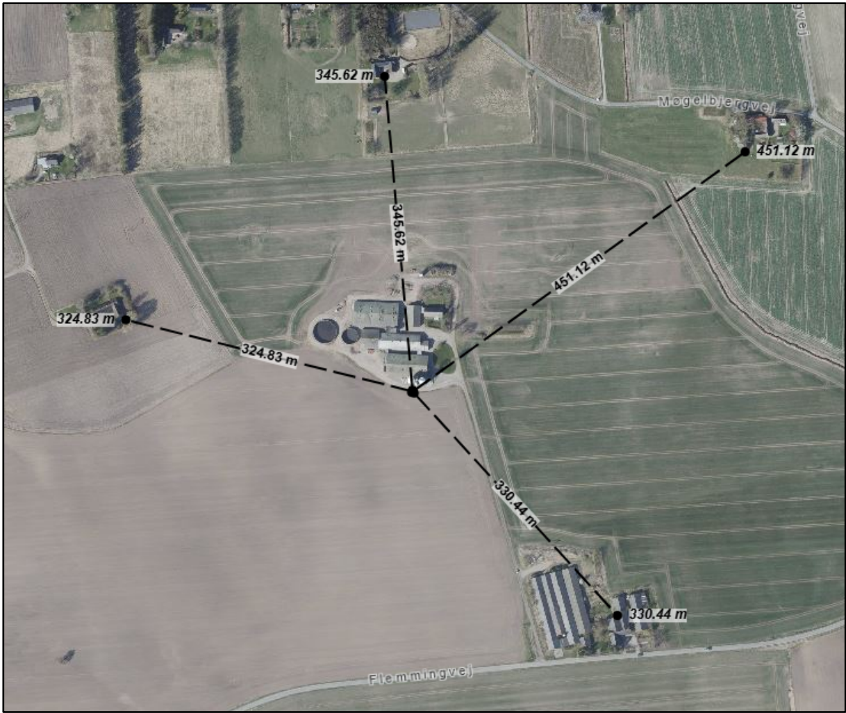
Figur 4. Oversigt over afstand til naboer.