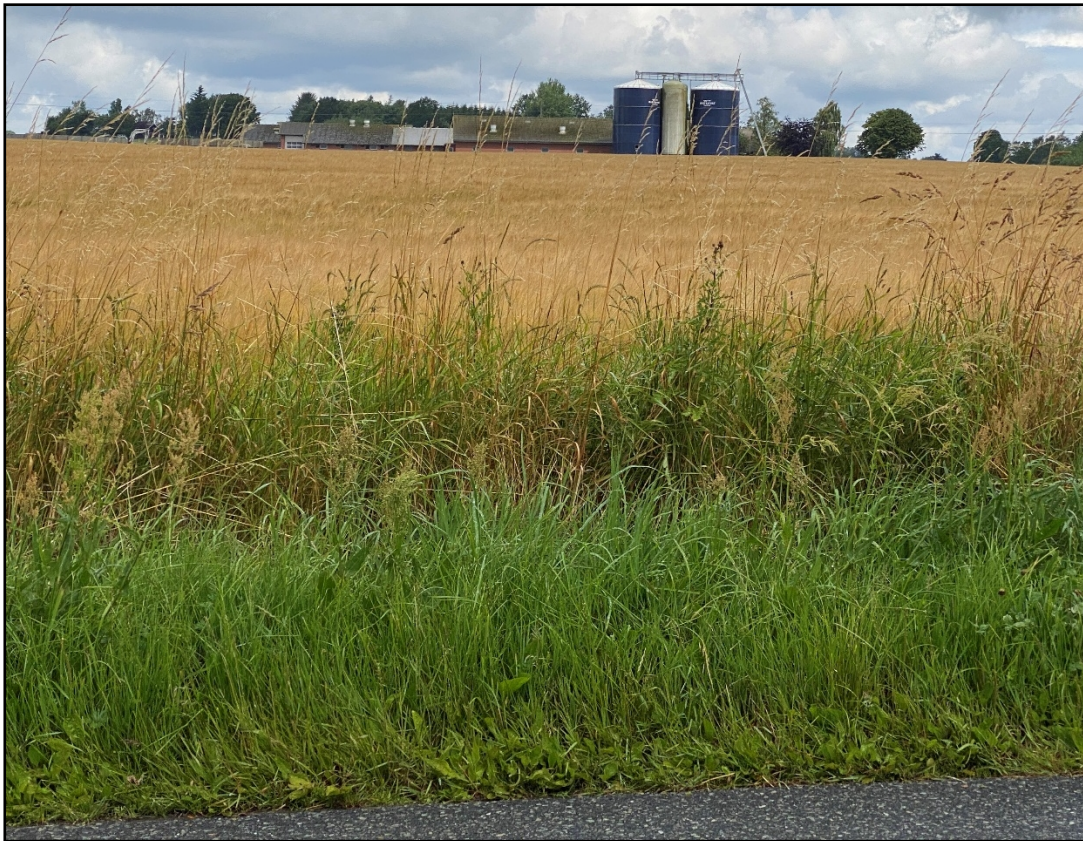
Figur 5. Indkig mod Flemmingvej 16 fra den asfalterede vej tværs over marken (Flemmingvej). Billedet er taget den 8. juli 2025 i forbindelse med vurdering af landskabelige gener.