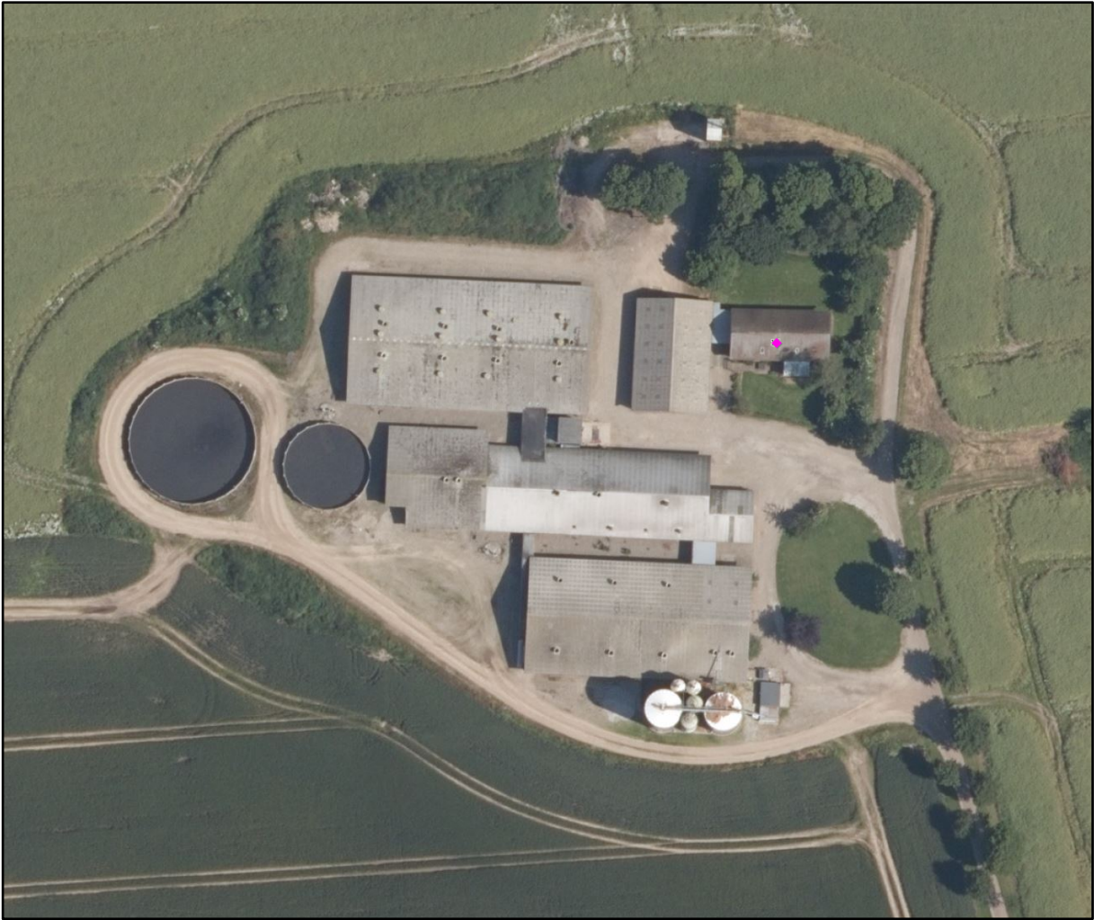
Figur 1. Oversigt over Flemmingvej 16, 8762 Flemming. Det eksisterende anlæg på sydlig side ses.