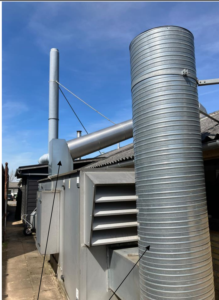
Ventilationsanlæg og centralstøvsuger