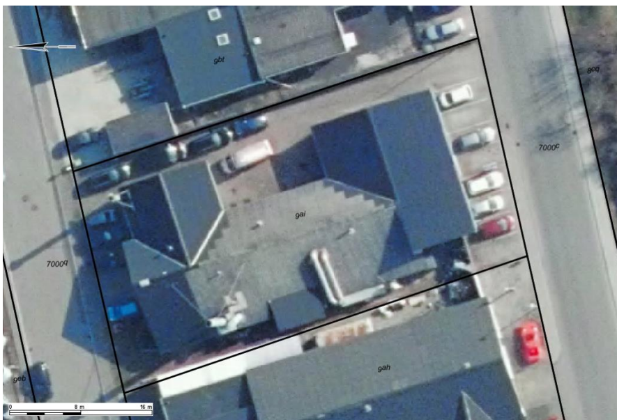
Oversigt over virksomheden