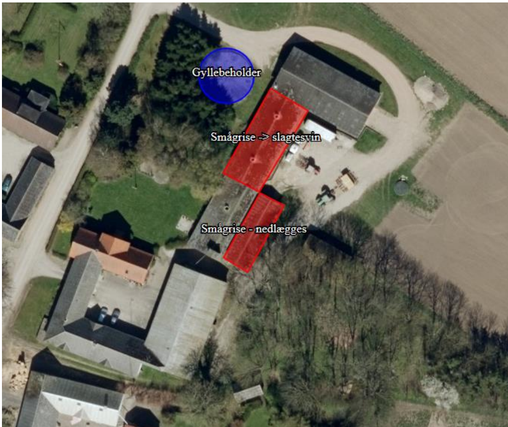
Kort 1. Sibberupvej 25. Staldanlæg markeret med rødt. Udvidelsen foretages i den nordlige beliggende stald. Den sydlige beliggende stald tages ud af drift.

Udvidelsen finder sted i den nordlige beliggende stald. Den sydlige beliggende stald tages ud af drift (se kort 1). Der foretages ikke nybyggeri i forbindelse med udvidelsen, og det er derfor ikke nødvendigt at foretage yderligere vurdering af ejendommens placering i landskabet.