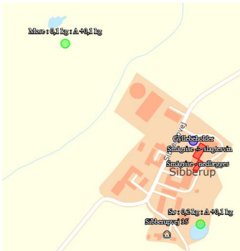
Kort 2. Kortfremstilling af total- og merdeposition på omkringliggende natur.

På nærliggende beliggende § 3 – natur i form af mose nordøst og sø syd for ejendommen er den kumulative merdepositionen udregnet til 0,1 kg N/ha pr år. Beskyttelsesniveauet er således overholdt.