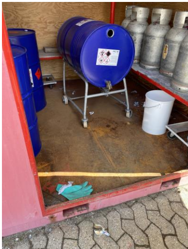
Opbevaring af fortynder i aflås container.

Det vurderes, at virksomhedens råvarer opbevares miljømæssigt forsvarligt.