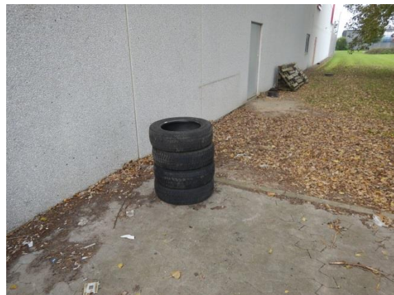
4. Brugte dæk.