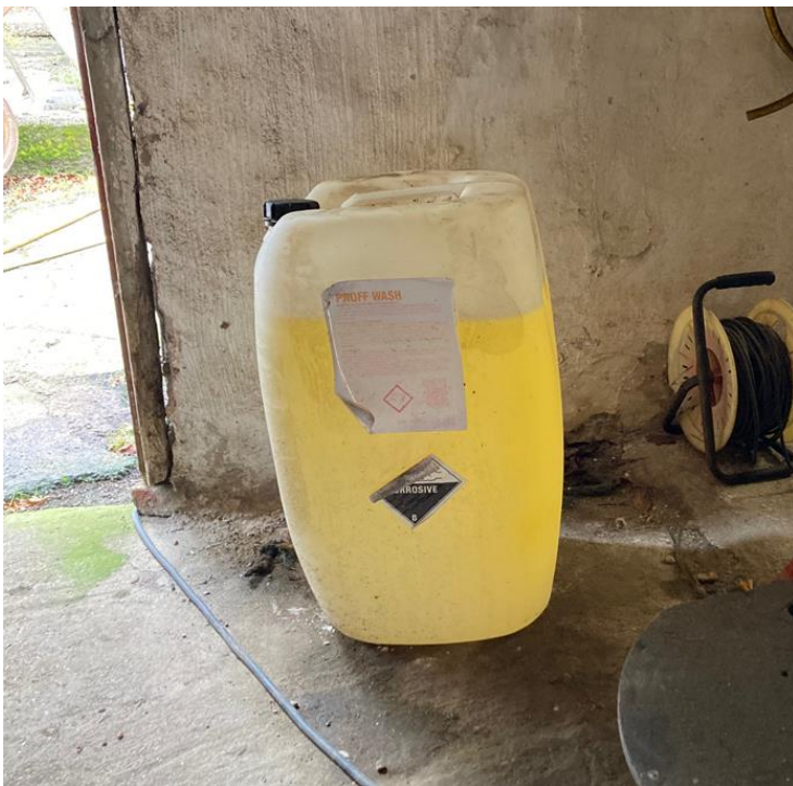
65 liter Proff Wash uden spildsikring.