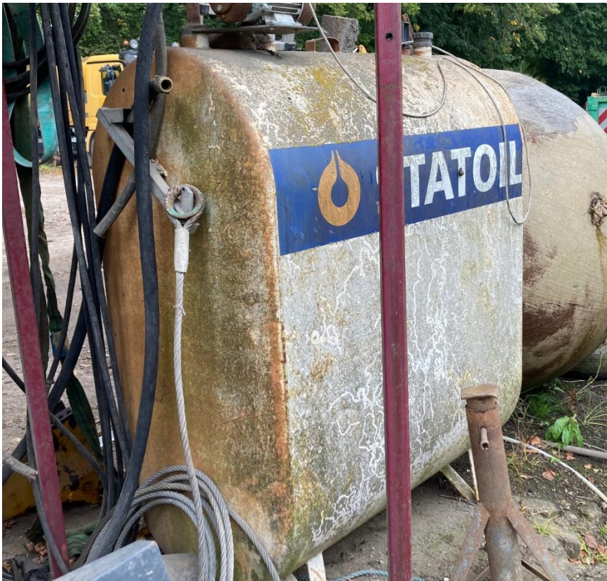
Eksempler på tomme olietanke, der ifølge virksomheden bliver fjernet fra pladsen.