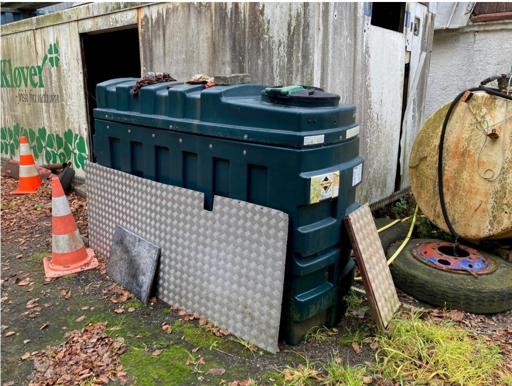
Kingspan dobbeltvægget spildolietank, placeret udenfor.