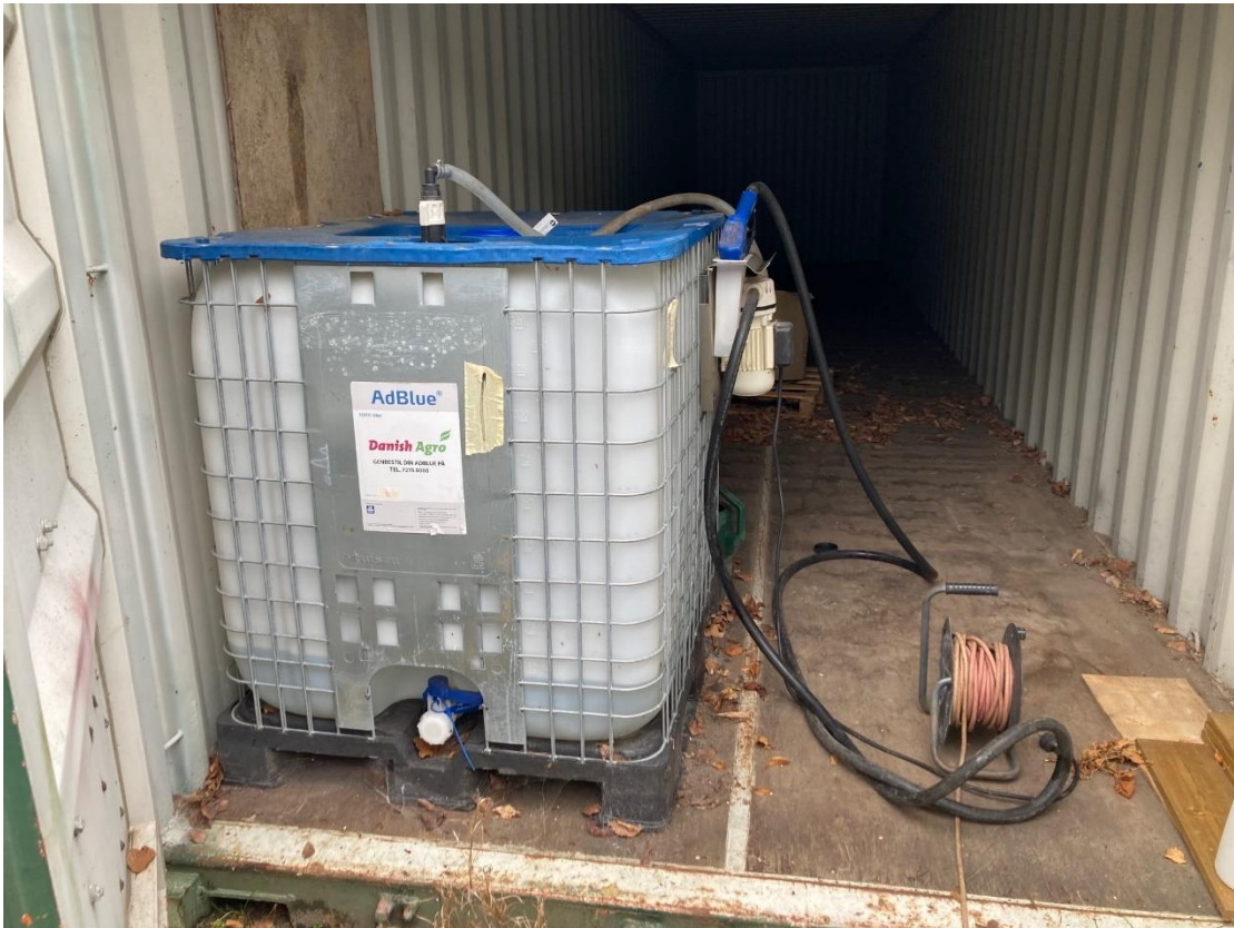
AdBlue i pallettank placeret i 40 fods container. Dørene står lukket mellem påfyldninger. Der var intet synligt spild på tilsynet. Terræn under containeren skråner, så eventuelt spild løber ned i containeren.