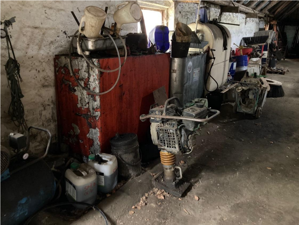
Spildolietanke 4. & 5. placeret inden for spildsikring i form af støbt betonkant.