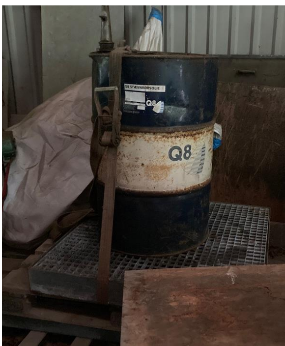
Stævnørsole placeret på spildbakke i kold hal.