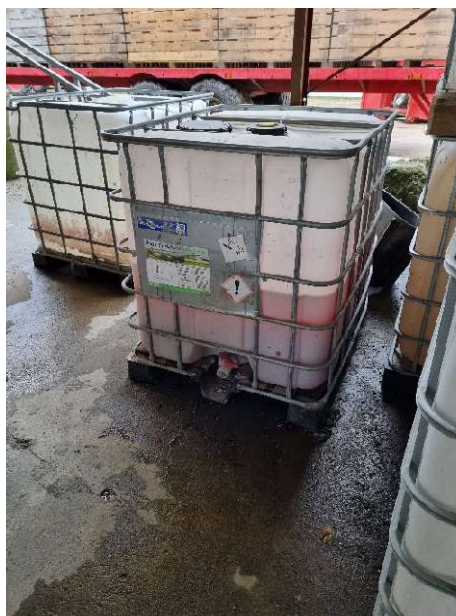
Pallettank in indhold af flydende gødning