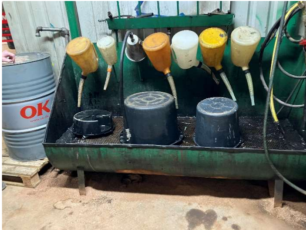
Opbevaring af flydende kemikalier på værkstedet.