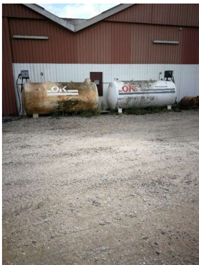
Virksomhedens køretøjer fyldes med dieselbrændstof fra 2 tanke placeret på ubefæstet areal.

Alternativt kan tankningen foregå indendørs på tæt belægning, hvor der ikke er afløb.