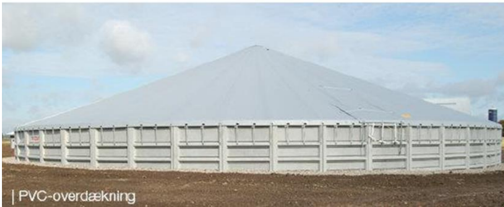
Figur 2: Eksempel på teltoverdækning