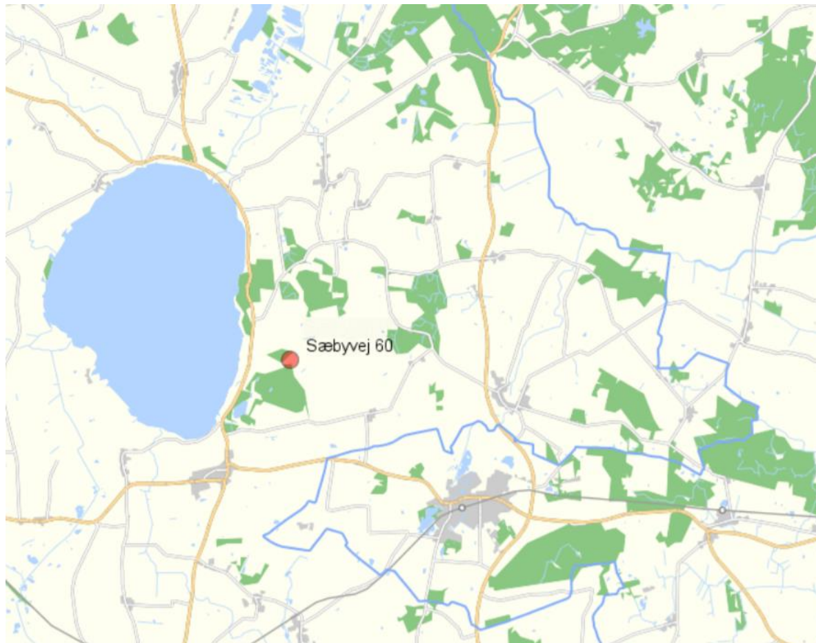
Figur 3: Ejendommens placering

Ansøgers oplysninger fremgår af afsnit 2.4.1 og 2.4.2 i ansøgningsteksten (bilag 1).