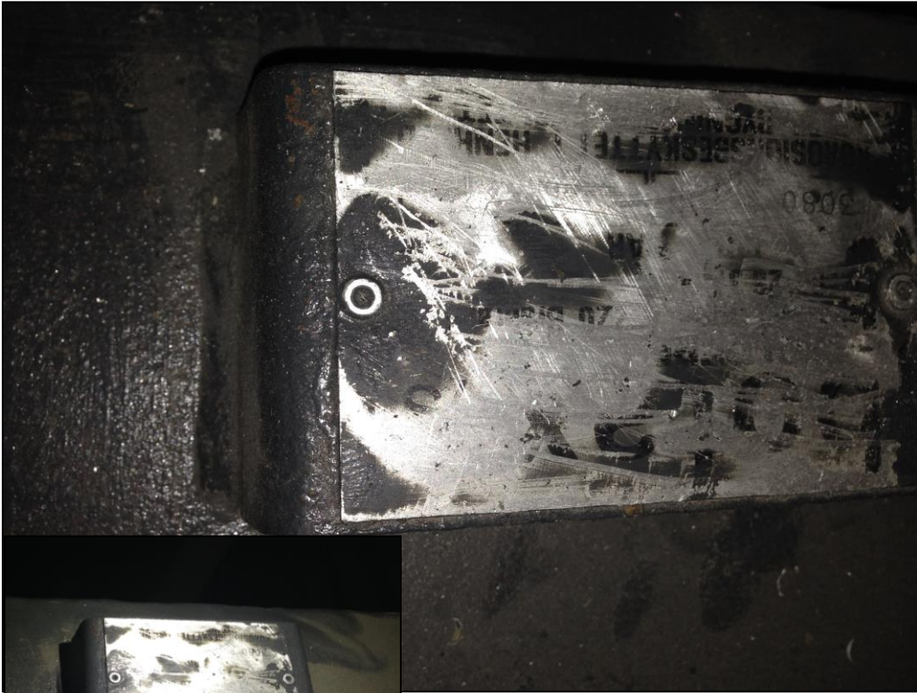
Foto af mærkeplade på tanken, der stod i det tilstødende tomme værkstedslokale.

Tanknummeret kan ikke aflæses og tanken er ikke registreret i BBR.