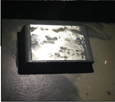
Tank og oliefyr