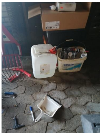
Billede 4 Oplag af ukendt kemikalie i garage 2 på belægning med SF sten

Det blev aftalt, at Materielgården fremskaffer spildbakker, som kan rumme indholdet af den største beholder til opbevaring af kemikalier, hvor der er risiko for at kemikalier kan løbe i kloak og ud på jorden som f.eks., i betonbefæstede rum med afløb. i kemikaliecontainer.