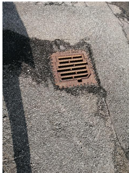
Billede 1. Vaskepladsen øst for garagen med opkant og to afløb tilkøbet olieudskillere.

Det blev aftalt, at Materielgården fremsender en opdateret kloakplan for vaskepladsen, som er underskrevet af en autoriseret kloakmester til virksomhedsgruppen, Miljø & Klima Syddjurs Kommune, som herefter vil vurdere, om pladsen kan anvendes som vaskeplads.