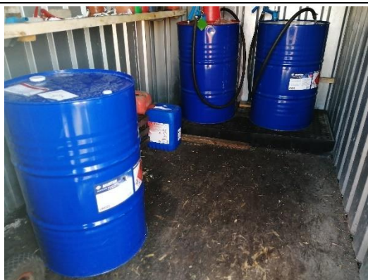
Billede 3. Oplag af benzin, hydrogenperoxid, olie i container syd for garage 2.