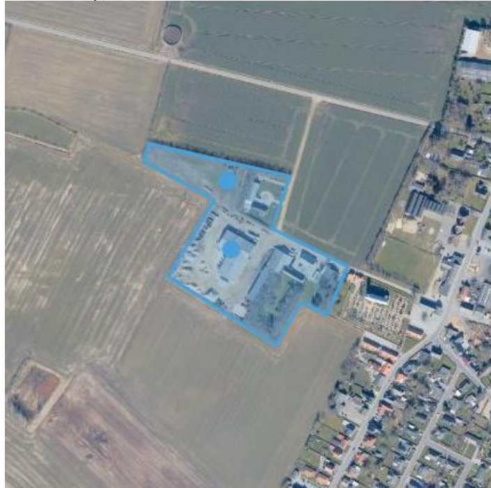
Figur 1: Lunde Maskinstations beliggenhed i det åbne land.

Virksomheden er beliggende i landzone på Gl. Lundevej 1 + 2, 6830 Nørre Nebel, matrikelnummer 8 Lunde By, Lunde samt 4a Lunde By, Lunde. Se nedenstående kort.