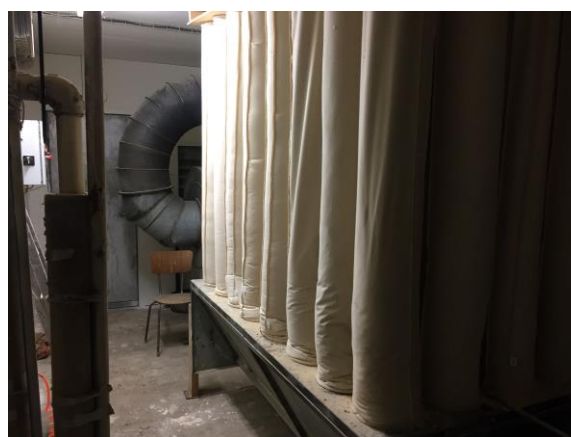
Poseanlæg til spåner og træstøv

Virksomheden har ikke afledning af processpildevand.