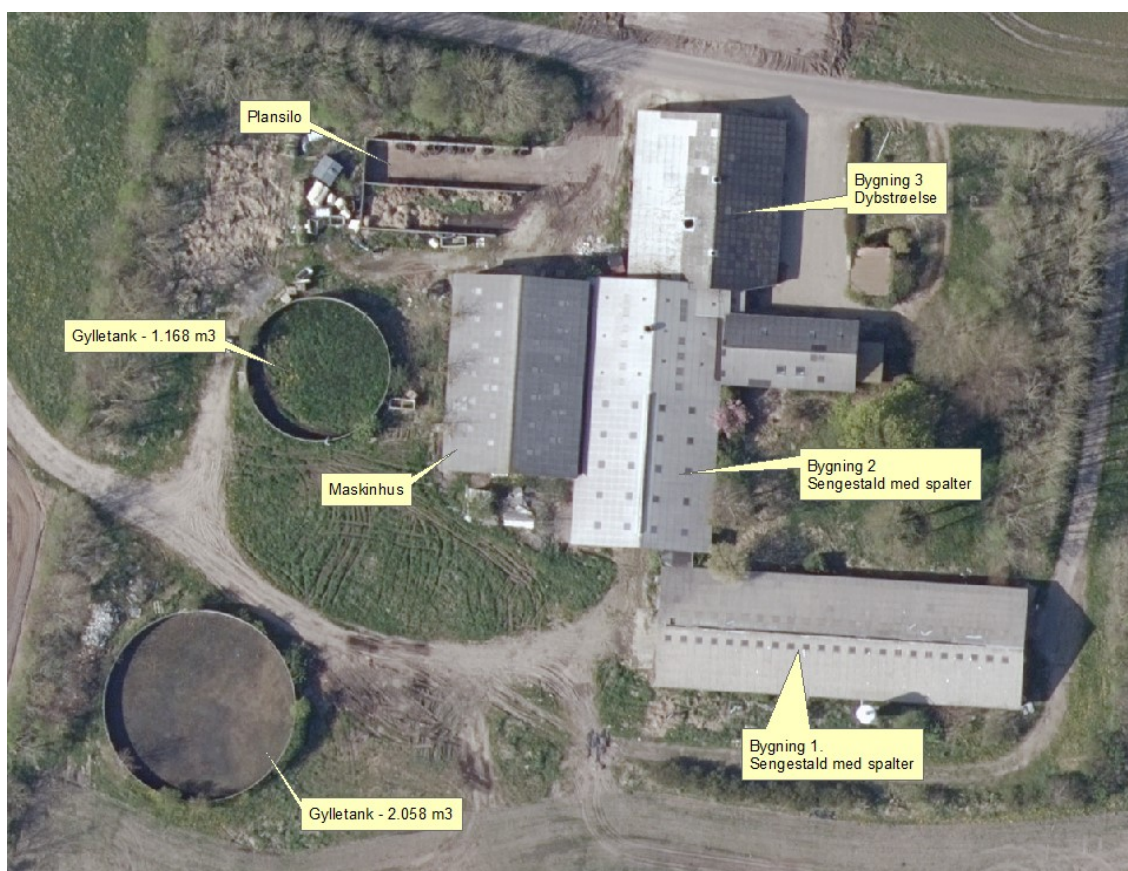
Figur 2. Oversigt over husdyrbrugets bygninger.

Oversigt over husdyrbrugets bygninger fremgår af figur 2.