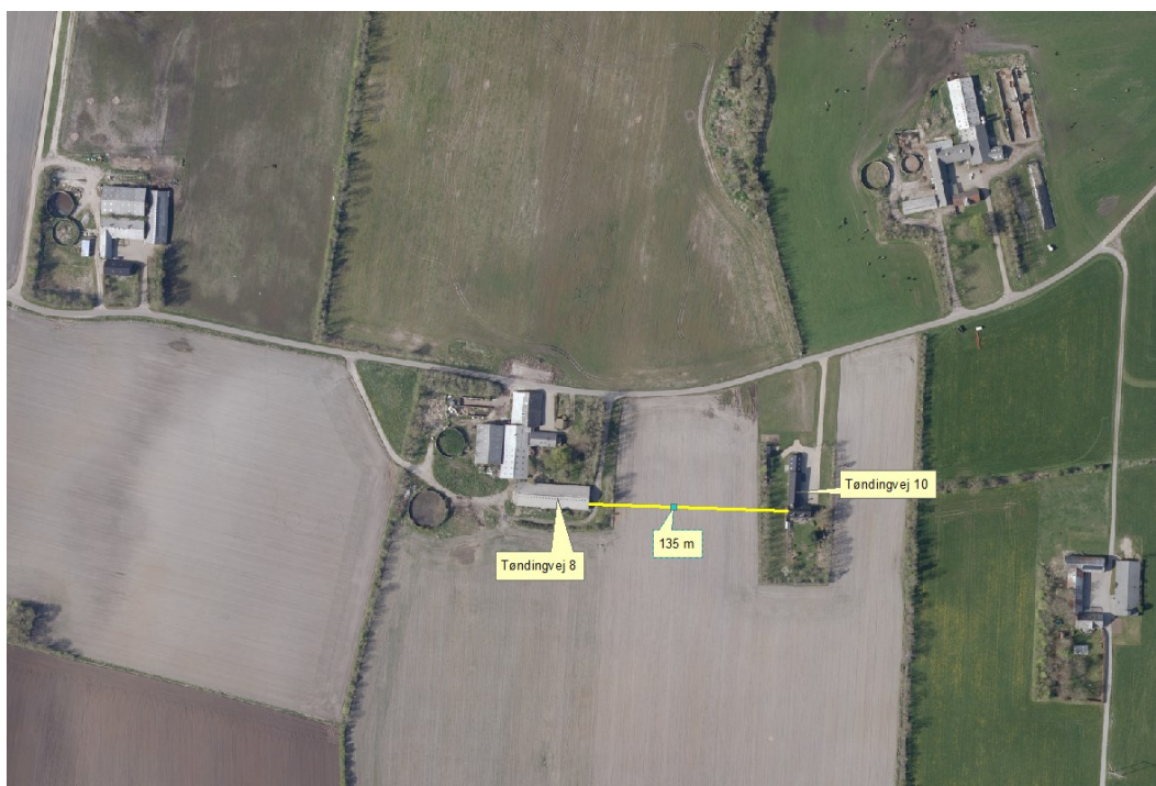
Figur 1. Husdyrbruget i forhold til nærmeste nabo.

Nærmeste nabo uden landbrugspligt, Tøndingvej 10, der beliggende ca. 135 m fra Tøndingvej 8, se figur 1.