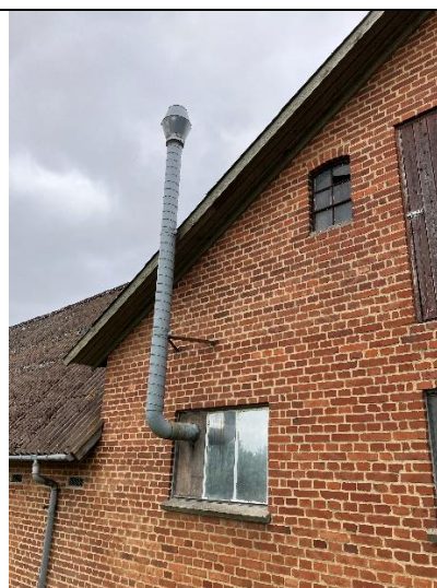
Afkast, blanderum, 2023