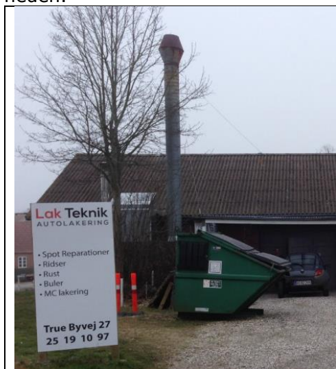
Afkast, sprøjtekabine, 2017

Afkast til sprøjtekabine og blanderum er mindre end 20 meter fra nærmeste bolig syd for virksomheden.