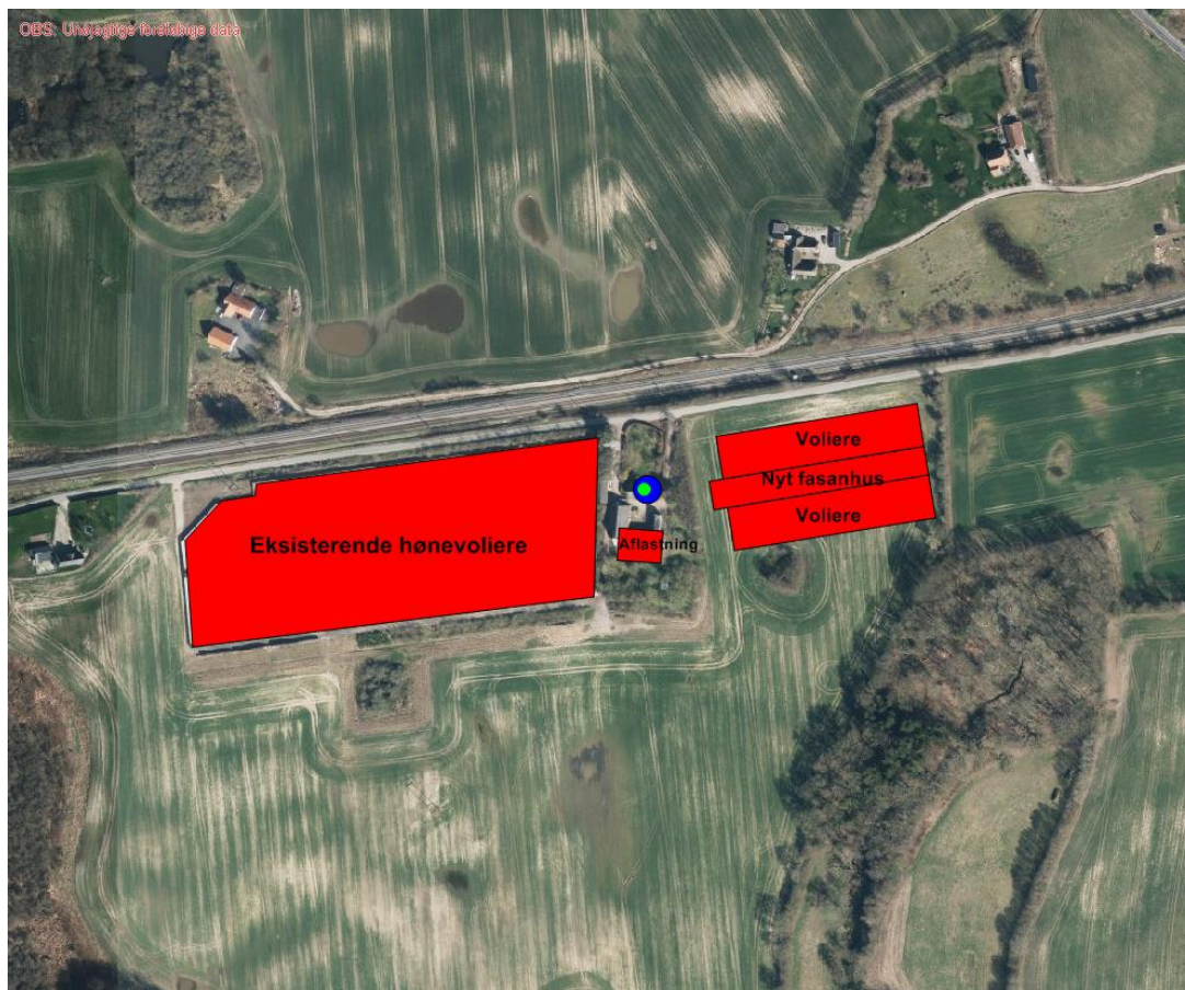
Figur 1: Lille Appe, Tobovej 75, 5690 Tommerup

Der er søgt om udvidelse fasanholdet til en årsproduktion på 7.000 stk. æglæggen- de fasanhøner (100 foderdage), 45.000 stk. fasankyllinger (0 – 6 uger), 7.000 stk. fasanopdræt (6 – 16 uger) og 7.000 stk. fasanhøner (122 foderdage), svarende til 24,39 DE.