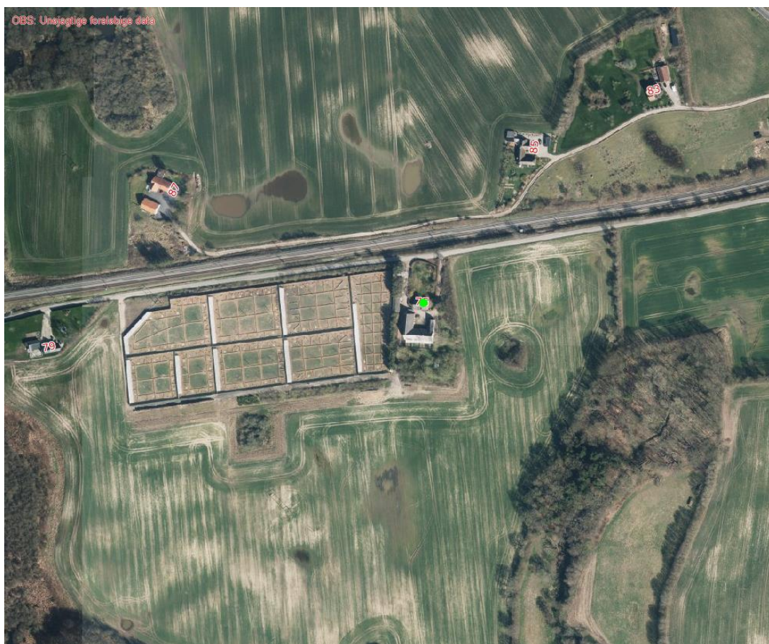
Figur 2: Nærmeste naboer til ejendommen Lille Appe, Tobovej 75, 5690 Tommerup.

Afstandskravet på 50 meter ifølge § 6 til byzone, sommerhusområder og lokalplaner er dermed overholdt.