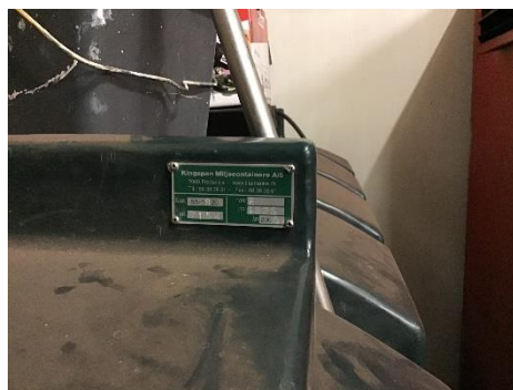
Olietank til fyringsolie, ikke korrekt registreret i BBR.