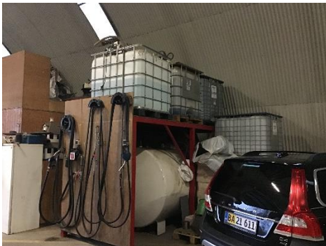
Olietank til maskindiesel, korrekt registreret i BBR.