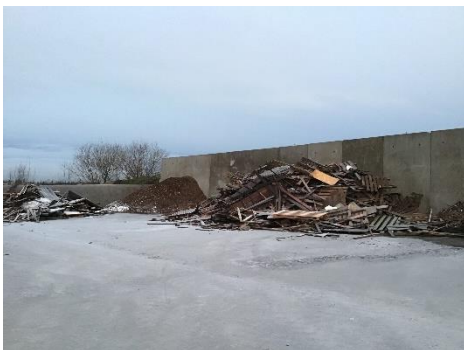
Betonbelagt plads til sortering af træaffald.