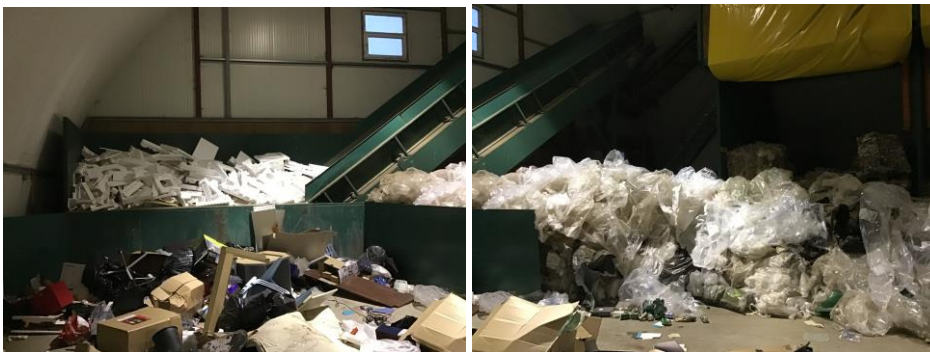
Sortering af blandet affald og komprimering af flamingo.