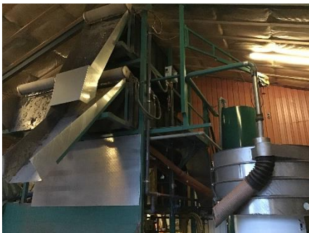
Sandvaskeanlæg med tilhørende vandtank.