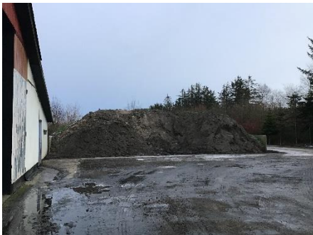
Oplag af sand fra sandfang på befæstet areal med kontrolleret afløb.