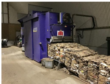
Komprimering af pap.