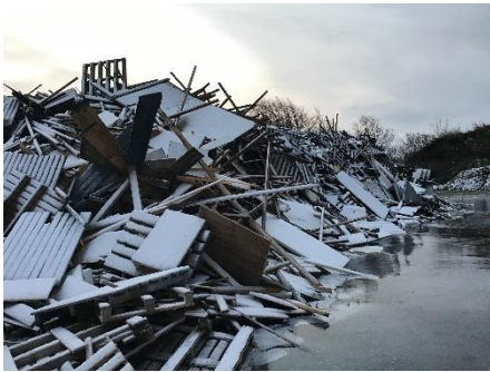
Træaffald på ubefæstet areal.