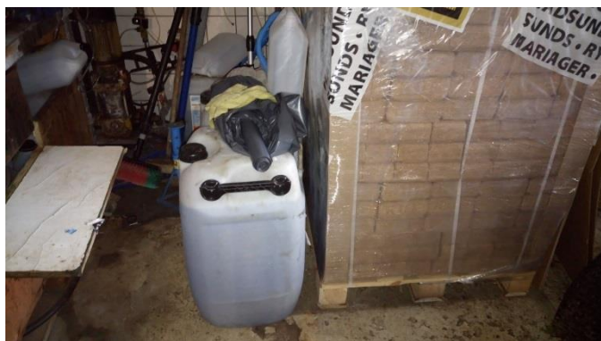
Billede 4: 60 L sprinklervæske i værksted