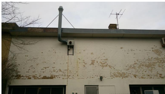
Billede 1: Afkast fra værksted