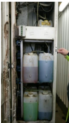
Billede 2: Opbevaring af vaskemidler i vaskehal