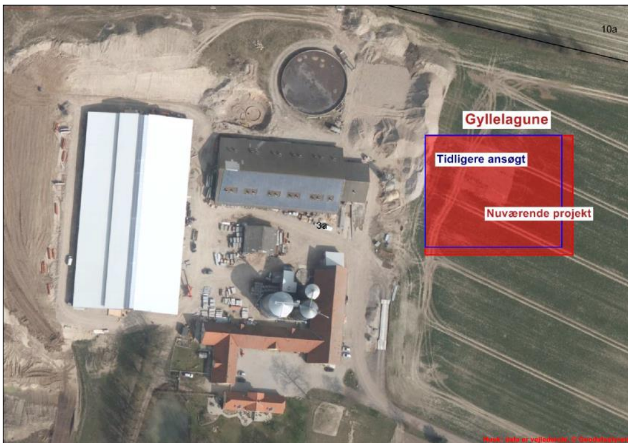
Anlægstegning: Blå markerer den tidligere projektering af lagunen, rød markerer den ansøgte.

Der er tidligere indsendt dokumentation fra firmaet bq millaq for, at etablering af gyllelagunen sker i henhold til byggeblad 103.04-30. Det er Kommunens vurdering, at når det er samme projekt, bare på 10.000 m 3 , er denne dækkende.