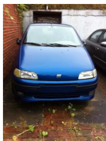
Fiat Punto 90

Virksomheden havde 4 skrotbiler stående.