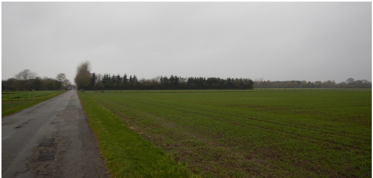
Figur 2. Billedet er taget fra øst mod vest hen mod Frederikshvilevej 9. Nord (til højre) for vejen ligger den nordlige fold bag træerne.

Når læhegnene er der, vurderer Brønderslev Kommune, at læskurene kan stå opstillet på de ansøgte steder i foldene uden at virke skæmmende og kommunen har således taget stilling til, at læskurene med de stillede vilkår passer ind i landskabet som en del af driften af hestepensionen på Frederikshvilevej 9.