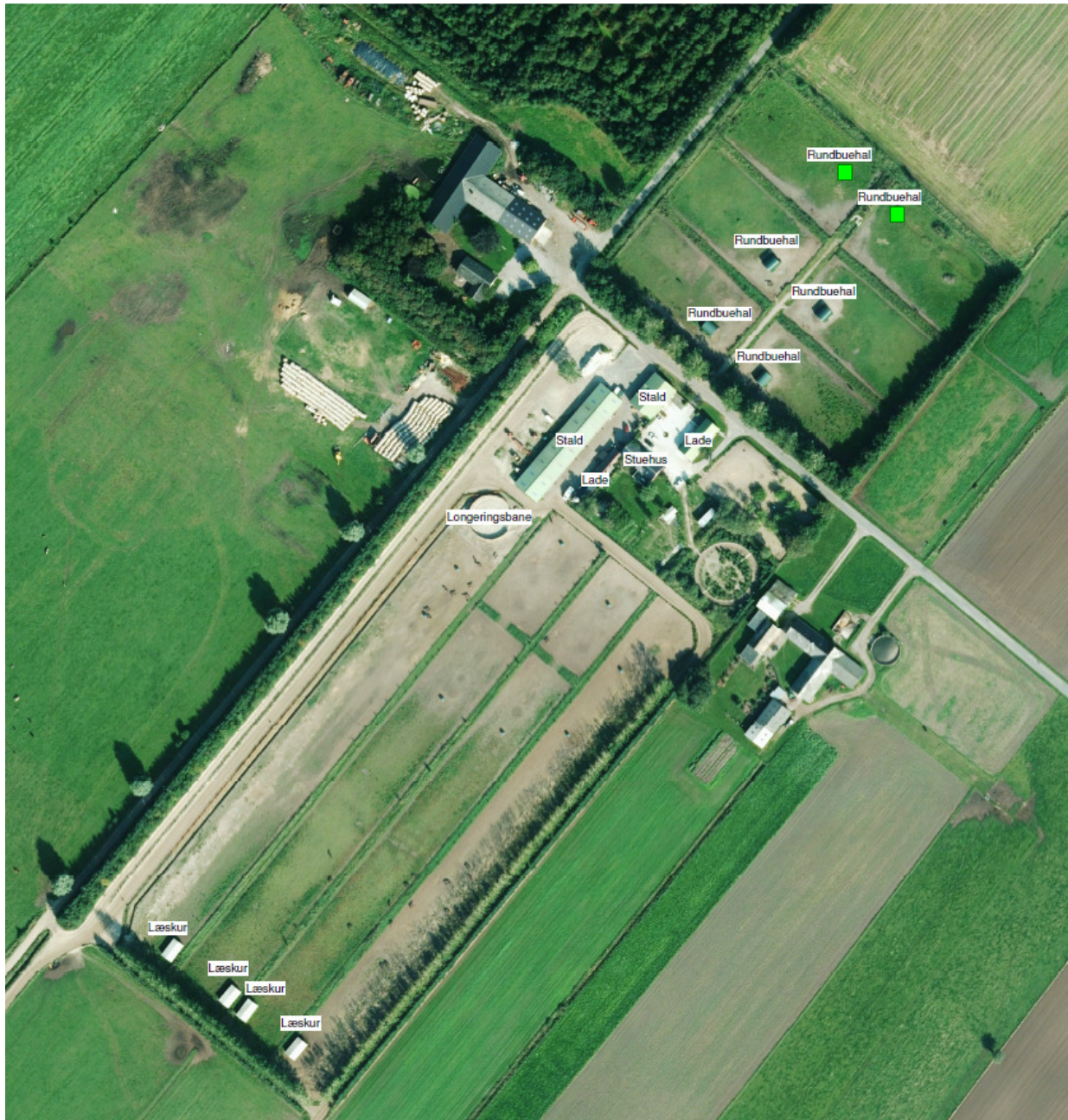
Figur 1. Oversigtskort over Frederikshvilevej 9.

Der sker ingen ændringer i den eksisterende bygningsmasse. Ansøger ønsker en tilpasning af produktionsarealet til hestene, hvilket sker ved at opstille 10 læskure i ejendommens to folde (4 læskure sydvest for ejendommens bygninger på hver 47 m 2 og 6 små rundbuehaller på hver 30 m 2 nordøst for ejendommens bygninger).