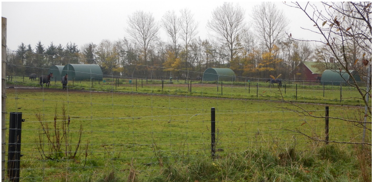
Figur 4. Læskurene i den nordlige fold set fra nordvest mod sydøst. I baggrunden ses en lade på Frederikshvilevej 9.

Brønderslev Kommune vurderer på baggrund af ovenstående, at læskurene kan opstilles uden væsentlige negative påvirkninger af landskabelige værdier.