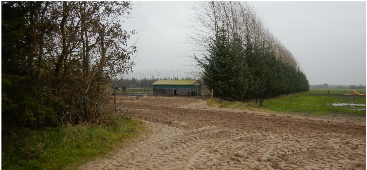
Figur 3. Et af læskurene i den sydlige fold set fra vest. Der er tæt læhegn omkring folden.