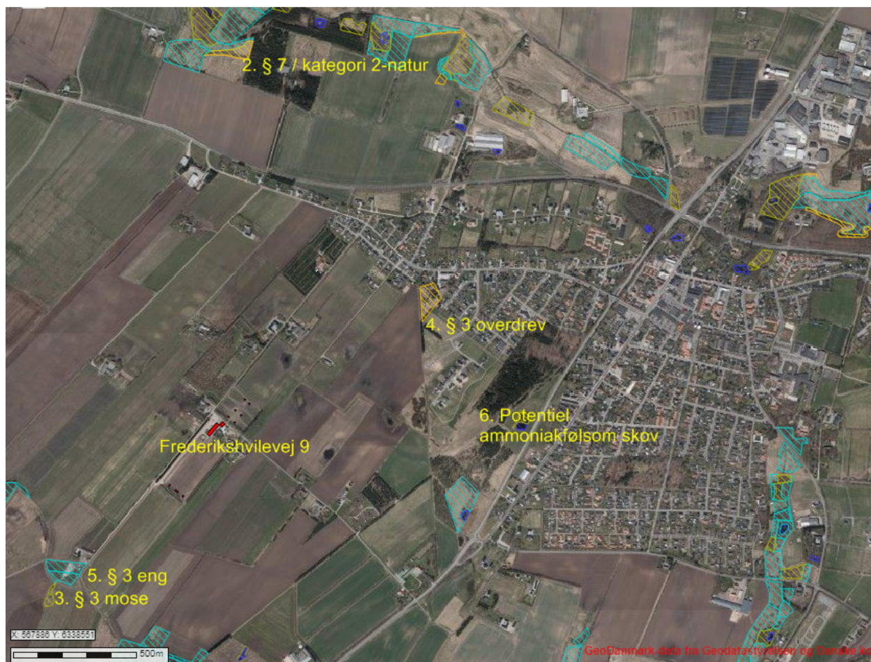
Figur 6. Kort, der viser naturpunkter omkring Frederikshvilevej 9.