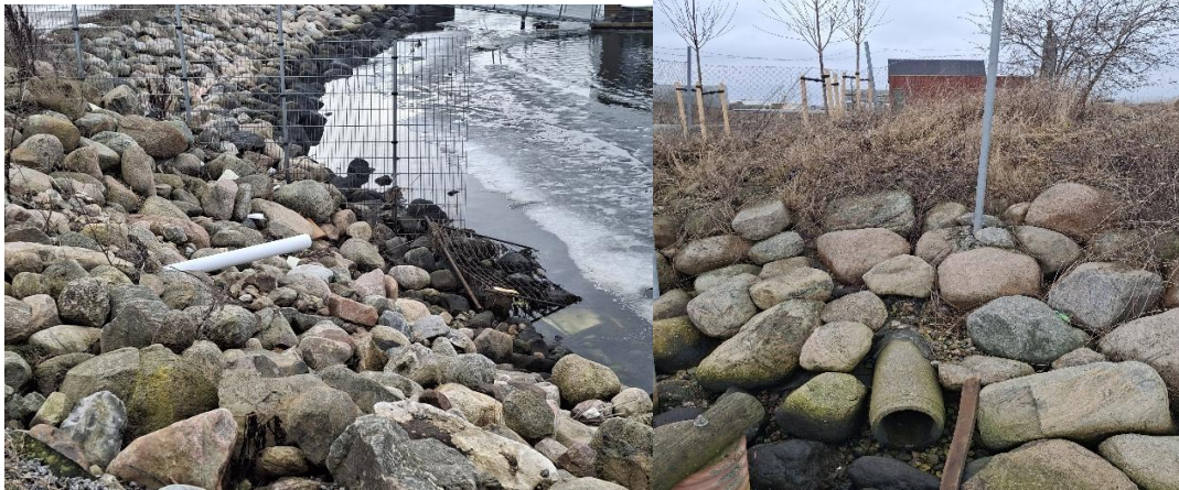
Billede 2: Rør fra dæmningen af depot, tv potentielt dræn fra depotet. Th rør fra matrikel ved siden af depot, røret havde en ledning løbende igennem

Dæmningerne på deponiet blev inspiceret, de var i god stand og uden tydelige skader/slid. Der var på dæmningen vækst af alger eller lav, der var intet tydeligt affald opskyllet langs dæmningen. Ud fra dæmningen stak nogle rør, det ene hvid værende et potentielt dræn i den sydvestlige side af deponiet. I den sydøstlige side af deponiets dæmning stak et andet rør ud, fra dette rør var der trukket strøm. Røret i den sydøstlige del af dæmningen var i udkanten af depotet, det blev på tilsynet umiddelbart vurderet at røret kommer fra nabo matrikel syd for depotet. Miljøstyrelsen ønsker redegørelse for dræning rør, se under opsummering.