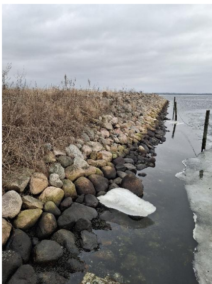
Billede 3: Billede af dæmningen omkring depotet, dæmningen fremstod i god tilstand.