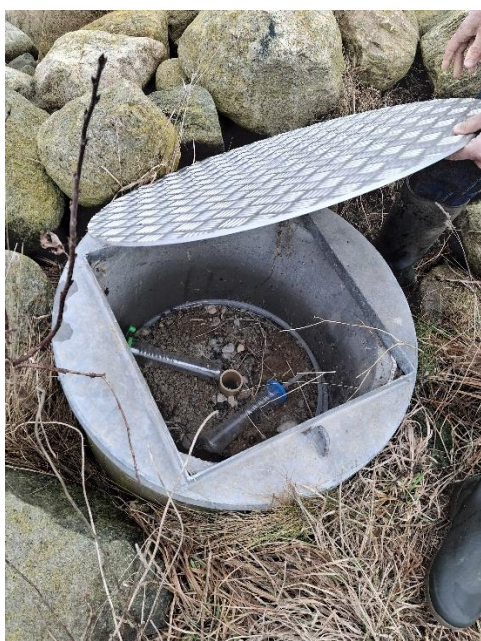
Billede 1: Boringen på depotet, låget var ikke aflåst og der lå affald intet DGU-nummer fremgik.

Miljøstyrelsen spurgte ind til driftspersonerne, de ville gerne vide hvem der stod for vedligeholdelsen af anlægget. Det blev aftalt kommunen vender tilbage herom, Det blev ligeledes aftalt at Miljøstyrelsen ville udrede hvorvidt personalet skulle have A-bevis eller lignende uddannelse, da der ikke længere driftes på anlægget.