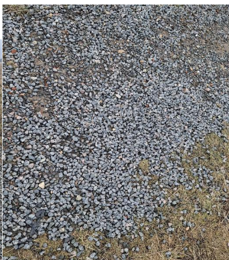
Billede 5: T.v billede af oplaget af sten på depotet, th billede af sten fra stien på depotet.