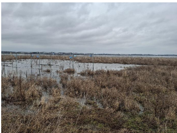
Billede 4: Billede af området hvor sætning var registreret ved forrige tilsyn, området umiddelbart omkring sætning hejnet af. Det var ikke muligt at se sætning, da der var opstuvet vand på depotet.

Der var mindre oplag af sten, disse bruges i vedligeholdelsen af depotets interne stier. Oplaget af sten var uniformt med belægningen på stierne, oplaget blev vurderet at være af passende størrelse til vedligeholdelsen.