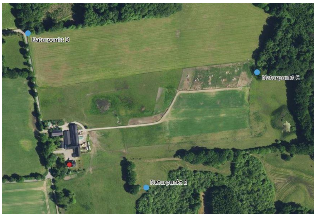
Figur 3. Oversigt over de nærmeste naturpunkter. Nærmeste kategori 1- og 2-natur ligger uden for figuren og er derfor kun angivet i tabellen. Selve husdyrbruget er markeret med en rød prik.

Ejendommen er beliggende ca. 5,6 km syd for det nærmeste internationale naturbeskyttelsesområde, Højen Bæk i Vejle Kommune. Flere af arterne, som er opført på EU-habitatdirektivets bilag IV (strengt beskyttede arter), er observeret i Kolding Kommune, men er ikke registreret i umiddelbar nærhed af husdyrbruget. Nærmeste registrering af løvfrø er ca. 95 m fra ejendommen.