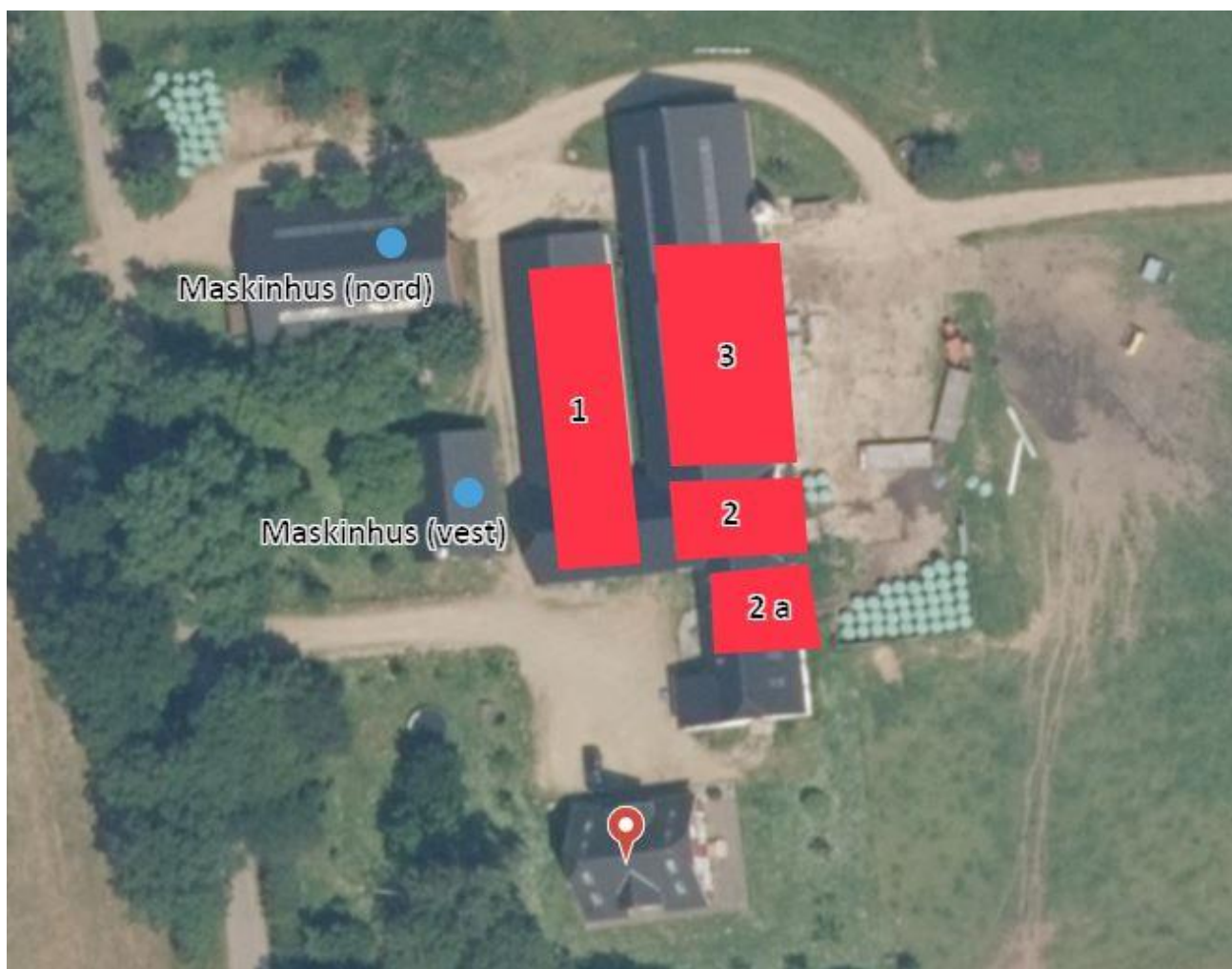
Figur 1. Oversigt over anlægget på Viuf Skovvej 86. Tallene referer til staldafsnittene i ansøgningssystemet.