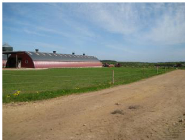
Byggefelt er udlagt og man kan se at der er lavet ny vej →