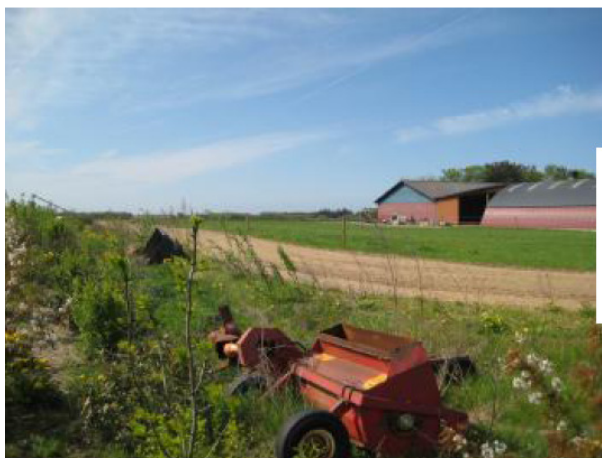
← Byggefeltet samt indblik i den allerede plantede beplantning.