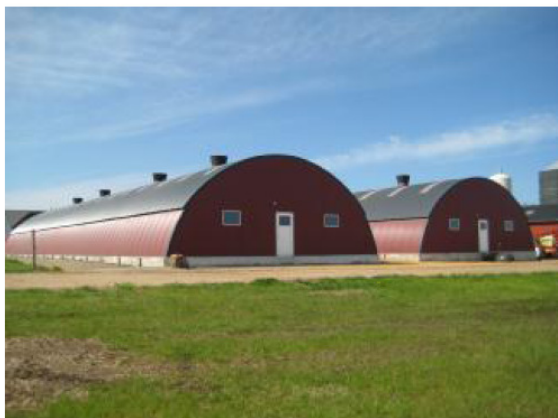
← De specielle stalde, som pt. kun laves af én leverandør