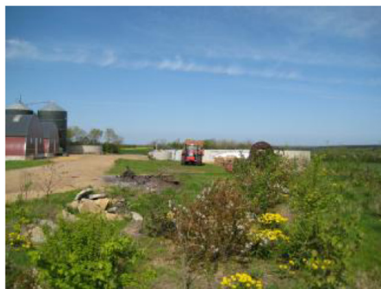
Beplantningen er flerradet og skjuler bunden af stalde, samt opbevaringsanlæg →