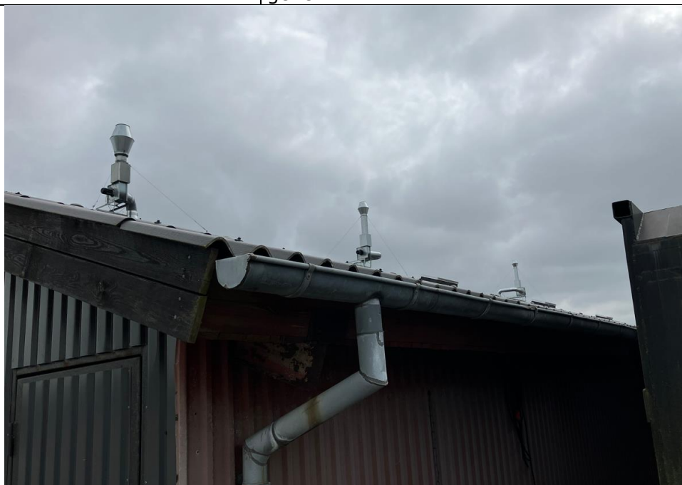
Fig. 4. Svejseafkast