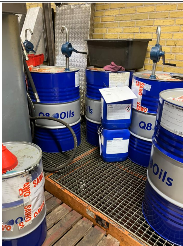
Fig. 2 og 3. Opbevaring af olier