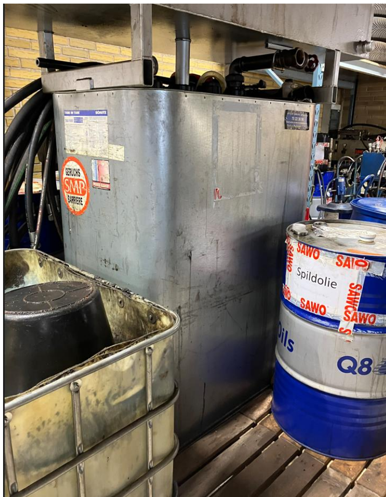
Fig. 5. Spildolie

Virksomheden har igangsat sortering af husholdningslignende affald.