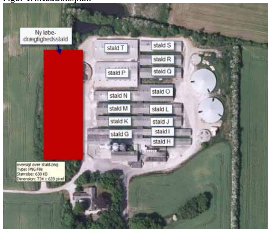
Figur 1. Situationsplan

Nærværende tillæg til miljøgodkendelsen af 27. september 2010 vedrører alene substitution af den oprindeligt planlagte gyllekøling i ældre staldafsnit med luftrensning. I forbindelse med ansøgning om dette tillæg ønskes der fortsat at etablere gyllekøling i den nye drægtighedsstald. Der ønskes derimod ikke længere gyllekøling i det eksisterende staldanlæg, idet der i stedet etableres en luftrenser (biologisk luftvasker) mellem bygning S og R (smågrisestalde). Der renses 59 pct. fra de to stalde, se bilag 1.