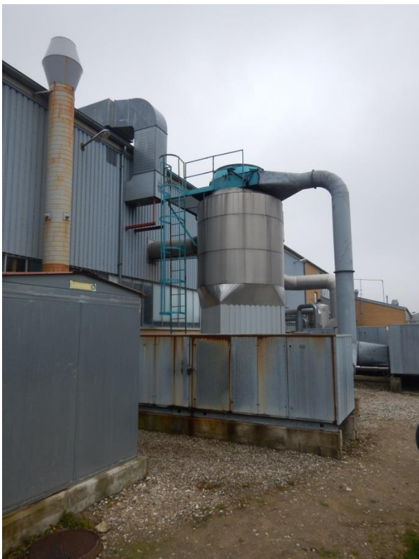
4. Filter fra coatingproces..