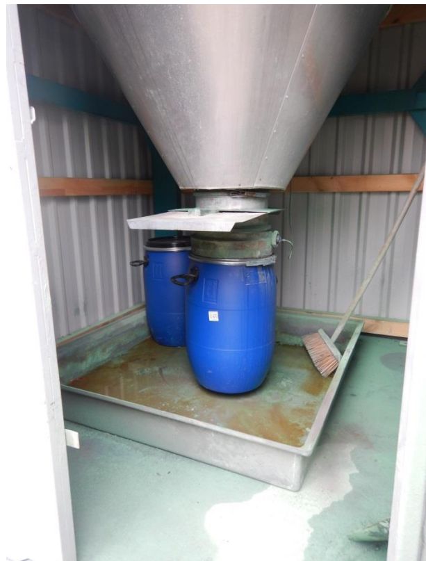
5. Filter fra coatingproces.