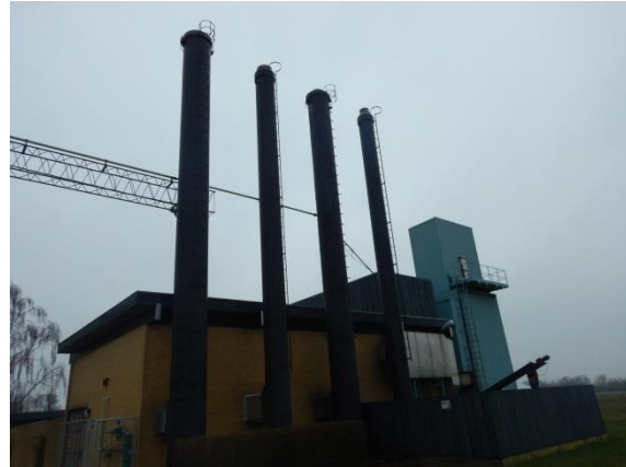
2. Skorstene fra venstre: Vandbeholdning, ikke i drift, afkast fra gasfyr, afkast fra biomassefyr.