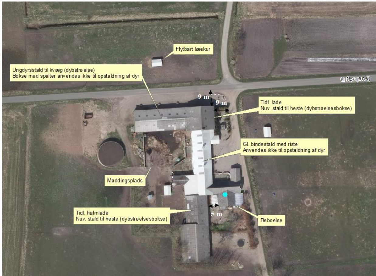
Kort 1. Situationsplan