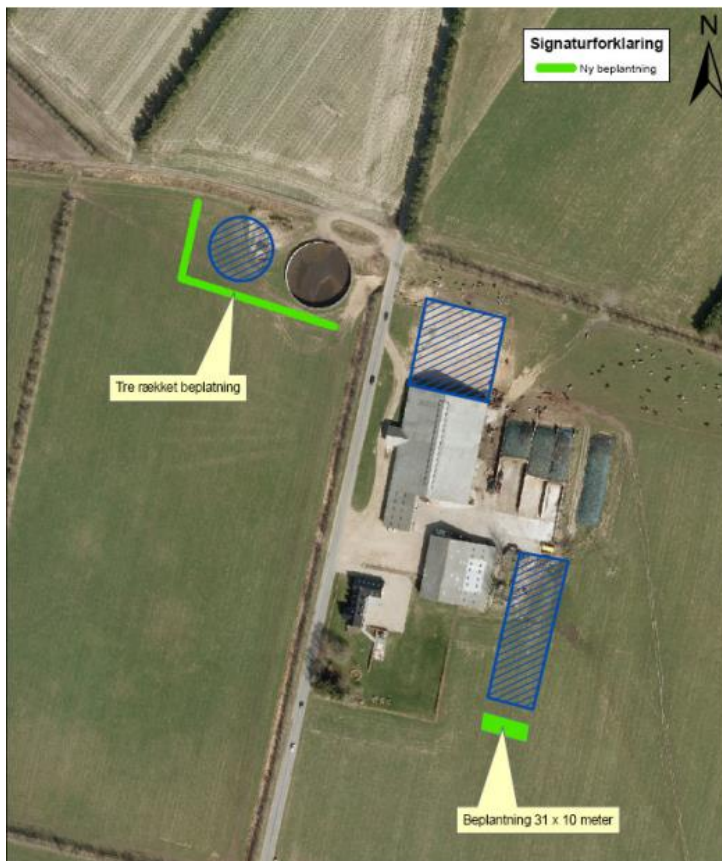
Figur 1. Vilkår om beplantning (markeret med grønt) i den tidligere § 12 miljøgodkendelse fra den 11. maj 2012. Det blå skraverede er nybyggerier godkendt i 2012. Figuren er fra miljøgodkendelsen i 2012.

Ansøger har i stedet for en beplantning omkring gylletankene etableret et nu veletableret 3-rækket læhegn langs den vestlige side af Mønstervej, som kommunen vurderer, afskærmer tilsvarende og dermed godkender. Varde Kommune sætter vilkår om, at læhegnet skal bevares og vedligeholdes og om nødvendigt omplantes fremadrettet.