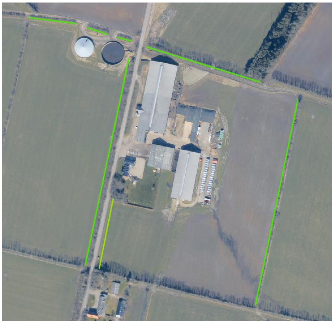
Figur 2. Der er vilkår om at beplantningen markeret med grønt bevares og vedligeholdes og om nødvendigt genplantes fremadrettet.