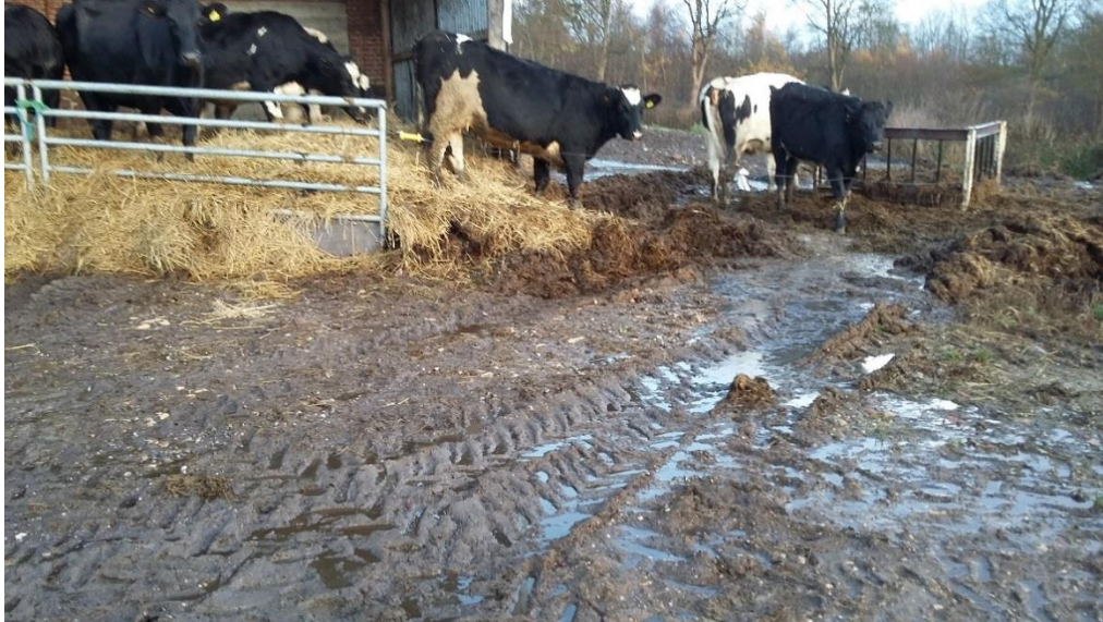
Halvtag med strøelse ved sydlig ende af lade, fodringsplads