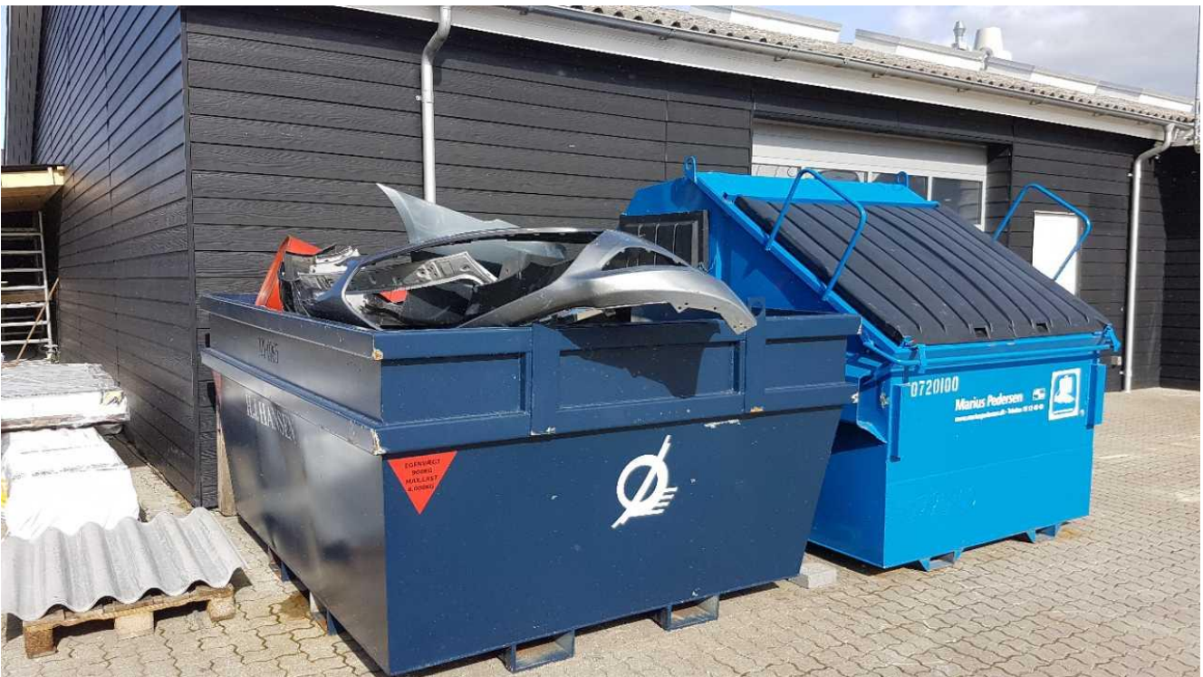
Affaldscontainere for metal/plast samt brændbart affald.