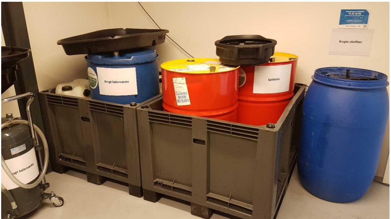
Opbevaring af farligt affald.