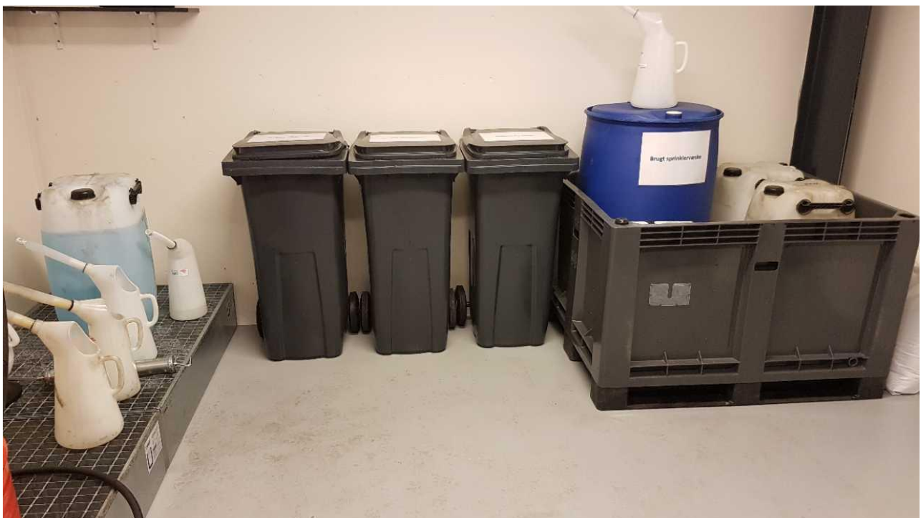
Opbevaring af råvarer og farligt affald.