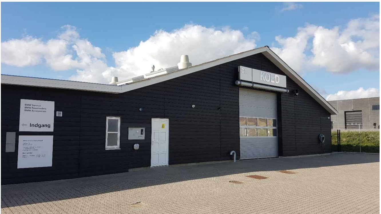
Afkast fra udsuget udstødningsgas er placeret mellem de to store afkast fra rumventilation.