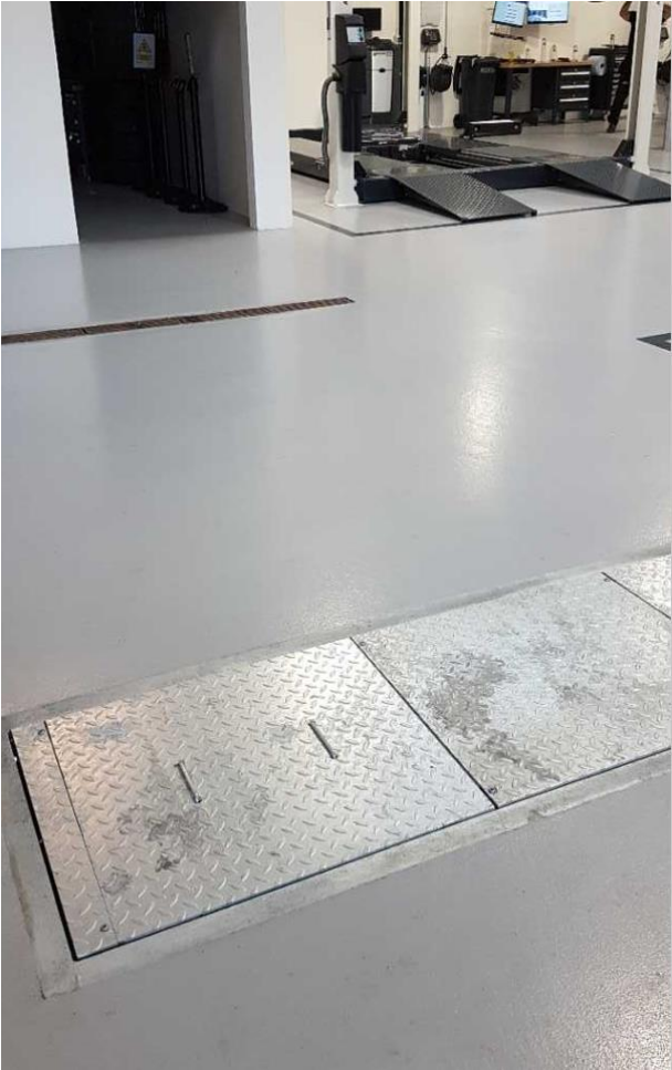
Afløb ved bremseprøvestand (forrest) er koblet sammen med værkstedets afløbsrender (bagest), som afleder til kloak via sandfang og en olieudskiller.