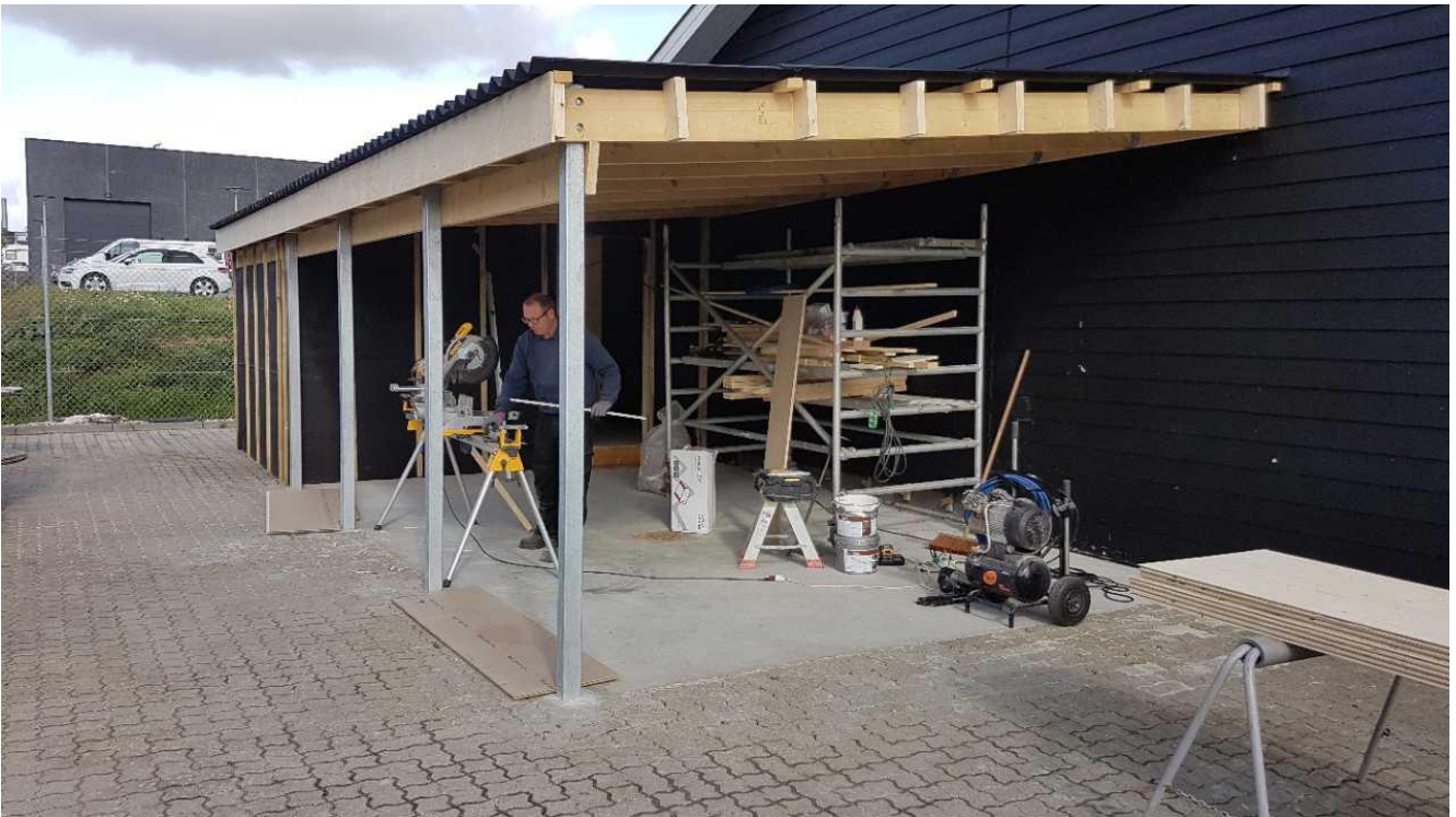
En overdækket vaskeplads er under etablering.