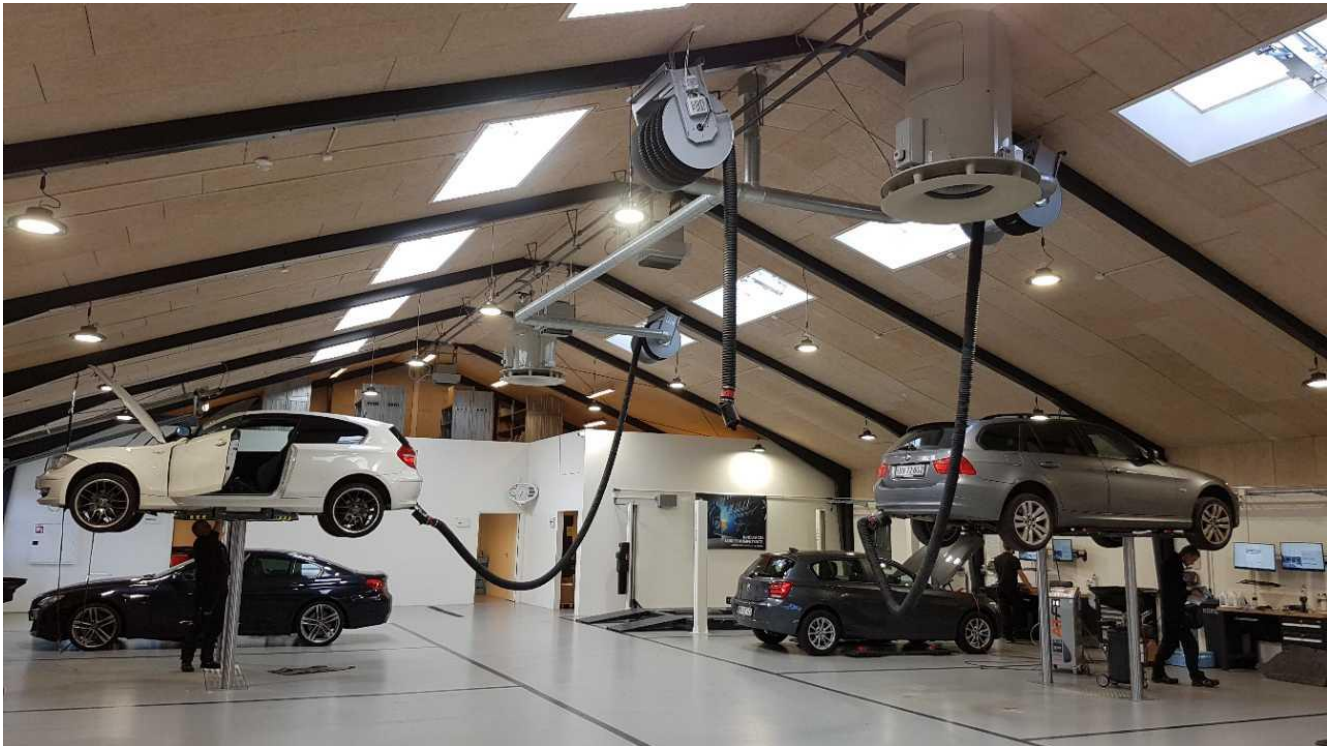
Der er tre flexslanger til udsugning af udstødningsgas.