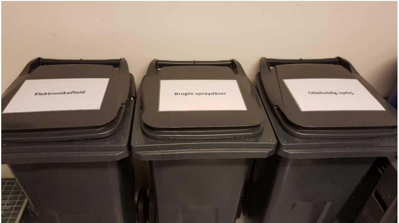
Opbevaring af farligt affald.