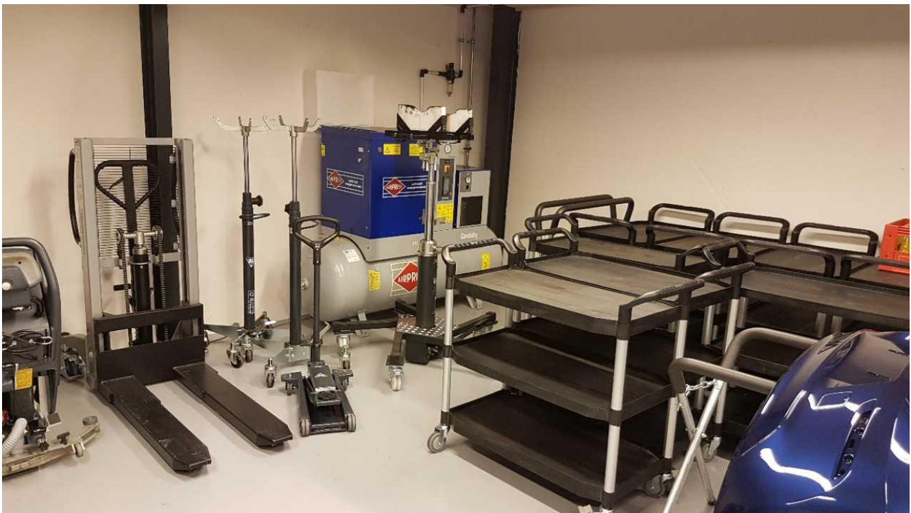
Kompressoren er placeret indendørs og er i øvrigt en støjsvag skruekompressor.