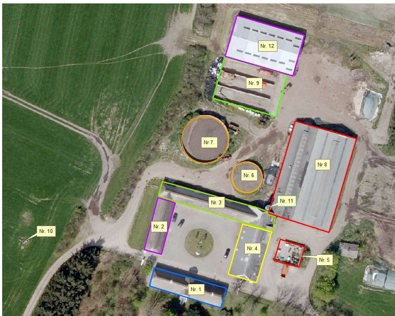
Figur 1. Oversigt over bygninger på Strandvejen 260.

Figur 1 viser en oversigt over bygningerne på Strandvejen 260.