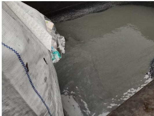
Container med bigbags indeholdende aktivt kul, samt et kig ned i containeren.

Containeren er ikke beskyttet mod regnvand og er samtidig tæt nok i bunden til, at der samler sig vand. Det vides ikke, hvor tætte selve bigbags'ene er, men kulstøv, der lejres på ydersiden af bigbags, kan vaskes ud i vandet i containeren. Ligeledes vurderes der at kunne sive uønskede stoffer ud fra bigbags, der er gennemvædede af regnvand i bunden. Hvis regnvandet blot tømmes ud, vil det forurene omgivelserne. Der er tilladelse til opbevaring af op til 65 tons aktivt kul.