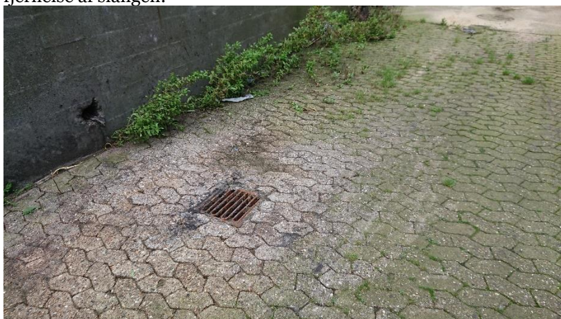
Rengjort område og slange fjernet efter tilsynet.

Virksomheden har efterfølgende sendt billedokumentation for oprydning/rengøring og fjernelse af slangen: