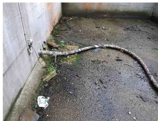
Billeder af belægning ved kloakafløb, slangen fra fabriksbygningen og oversigtskort med markering af den pågældende indergård.