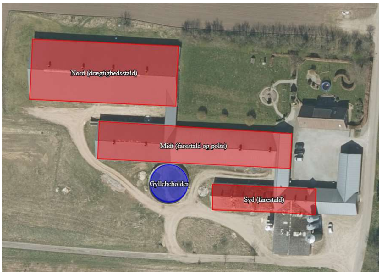
Figur 2 Staldenes placering på Kræmmervejen 28