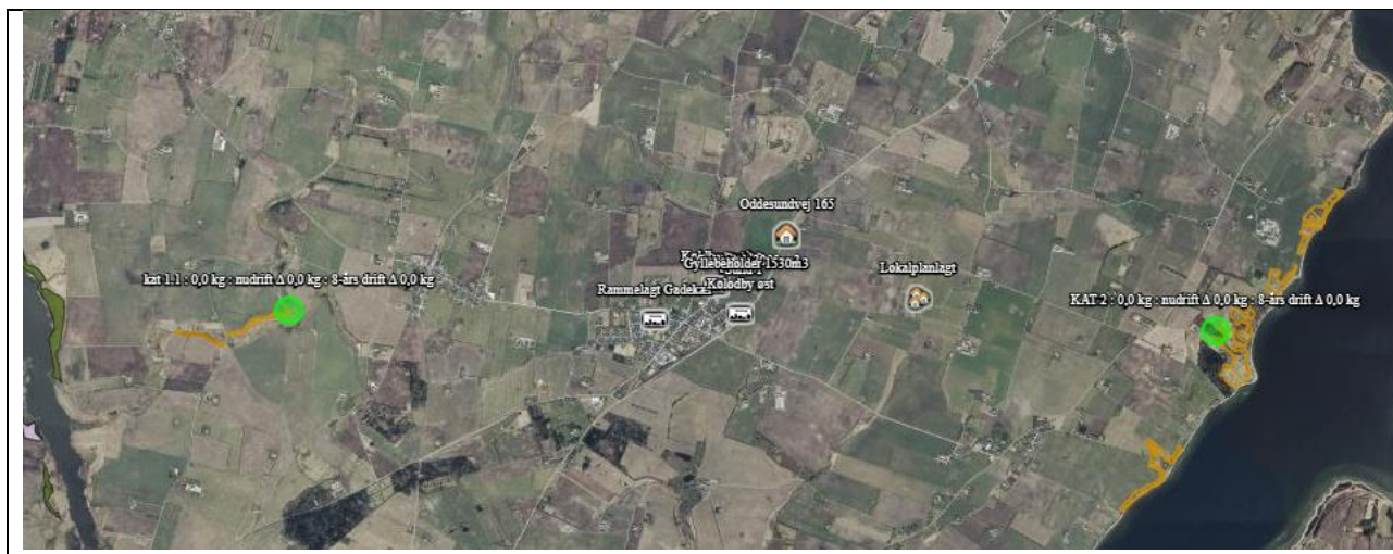
Oversigtskort over nærmeste kategori 1 og 2-natur