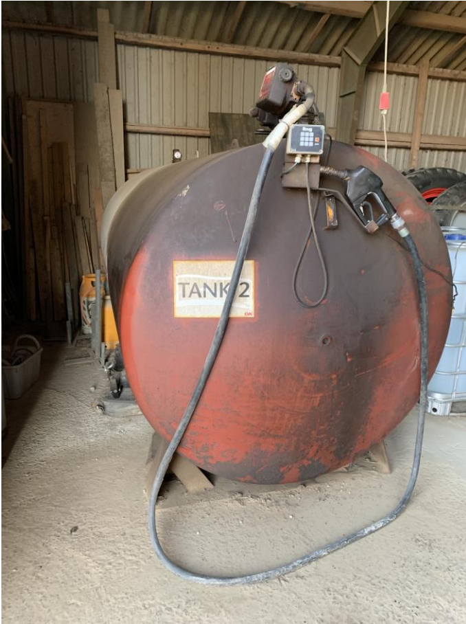
Olietank til traktordiesel, 5900 l, årgang 2004.