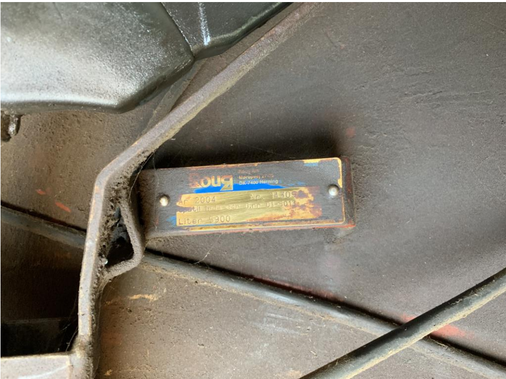
Mærkeplade 5900 i tank, årgang 2004 til traktordiesel.