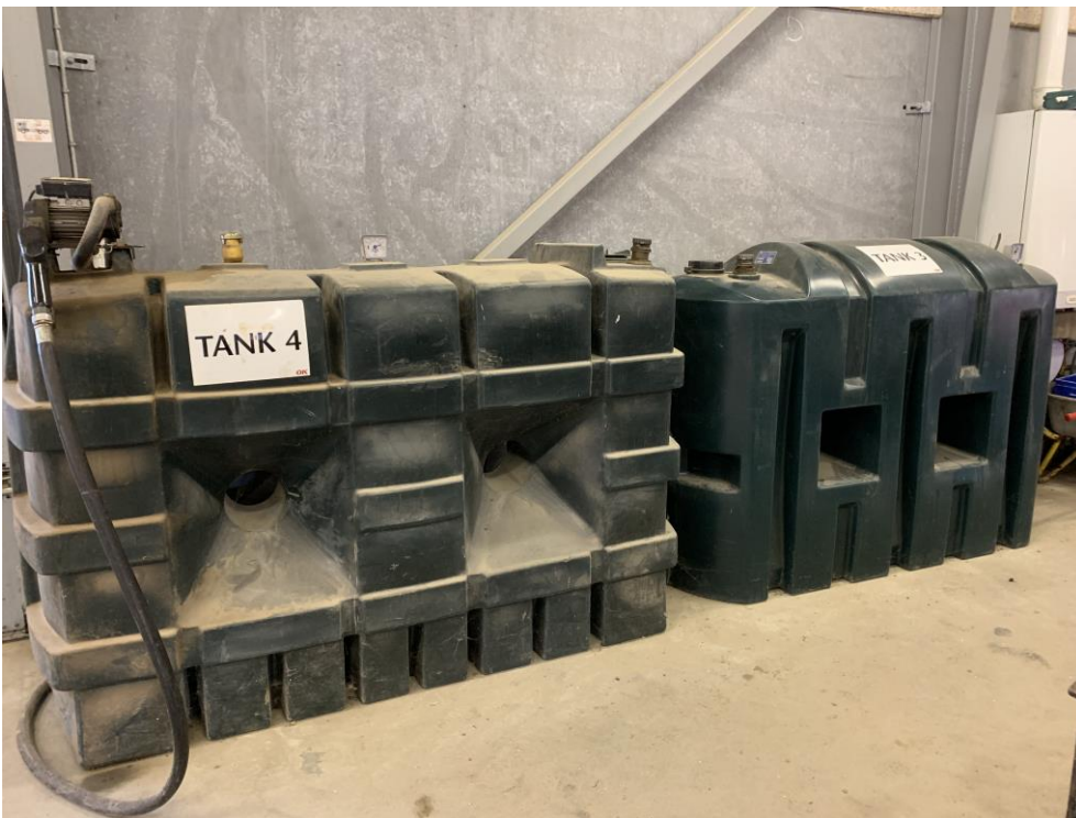
Tank 3 og 4, henholdsvis 1330 l til fyringsolie og 1500 l til diesel.