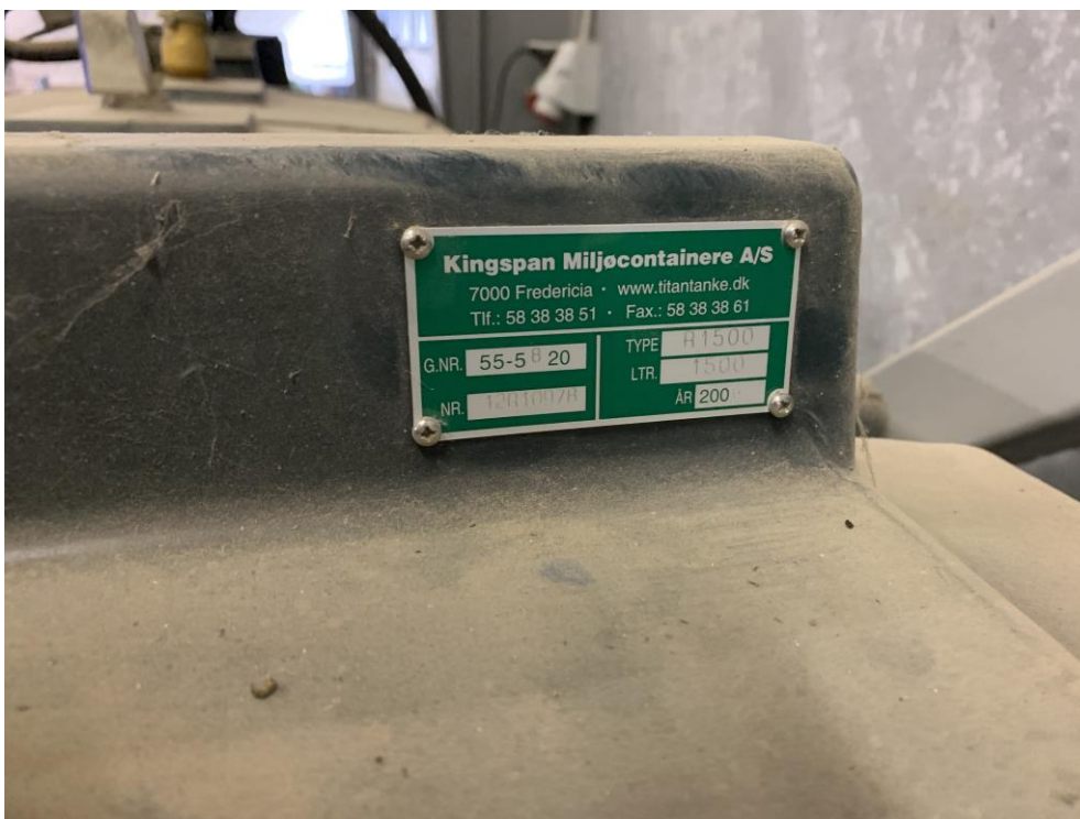
Mærkeplade plasttank 1500 l, årgang 2008 til diesel til biler.