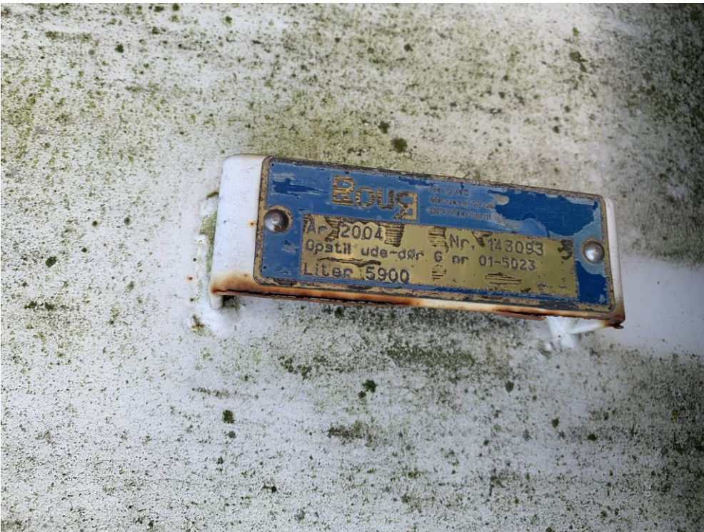
Mærkeplade 5900 i tank, årgang 2004 til fyringsolie.