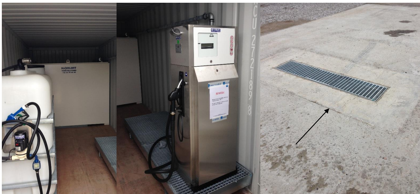
Fig. 1 Tank til diesel og AdBlue