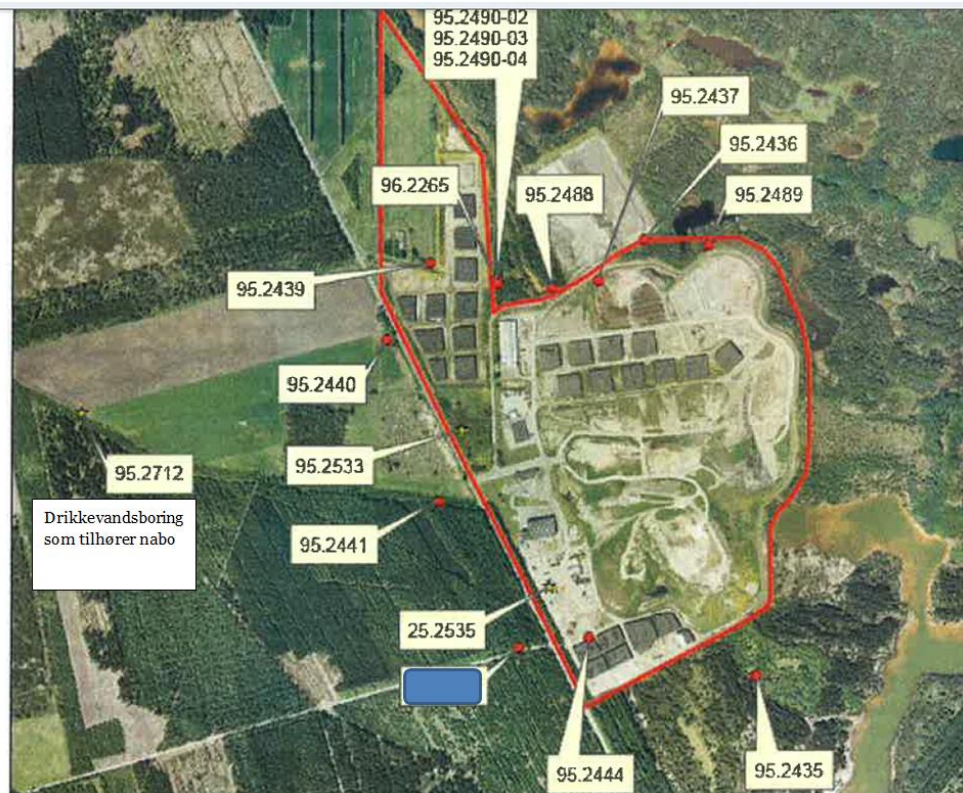
B Placering af monitoringsboringer med angivelse af DGU nr.

Det kunne konstateres, at mange boringer ikke lever op til kravene i brøndborerbekendtgørelsen 1 , hvorved der er en risiko for indtrængning af forurenede overfladevand m.v.. Dette kan udgøre en risiko for de grundvandsmagasiner, man har gennemboret. Som nævnt ved tilsynet, er kommunen myndighed for denne bekendtgørelse, og Miljøstyrelsen orienterer derfor Herning Kommune om forholdet.