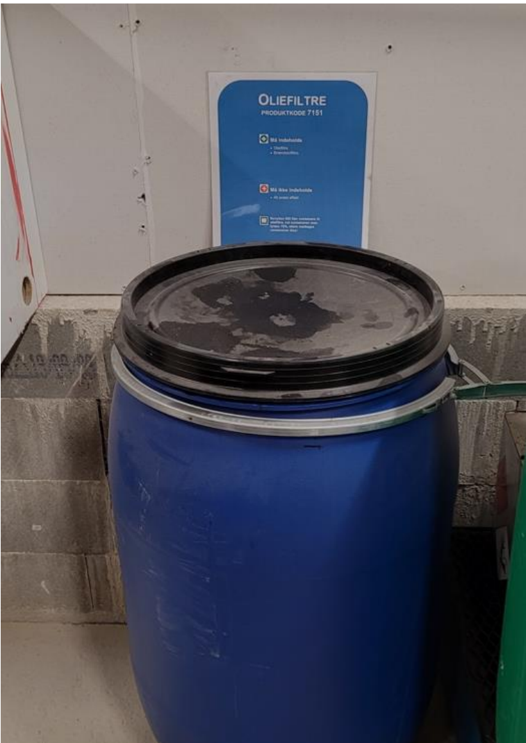
Opbevaring af oliefiltre.