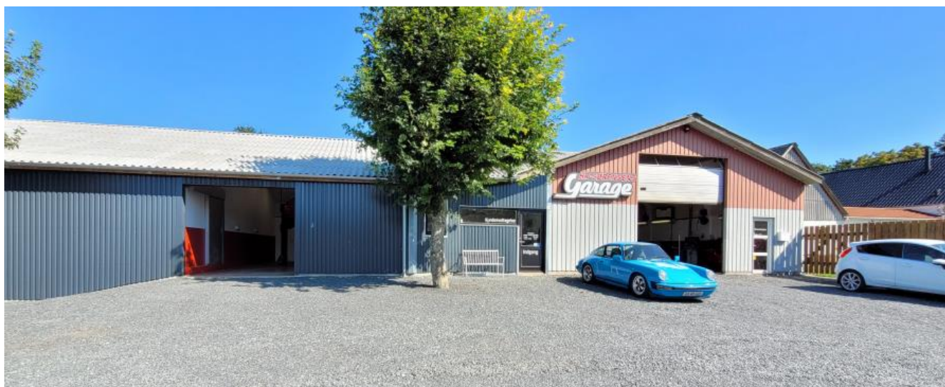
Porten til venstre er til den nye værkstedshal og porten til venstre er til den gamle.