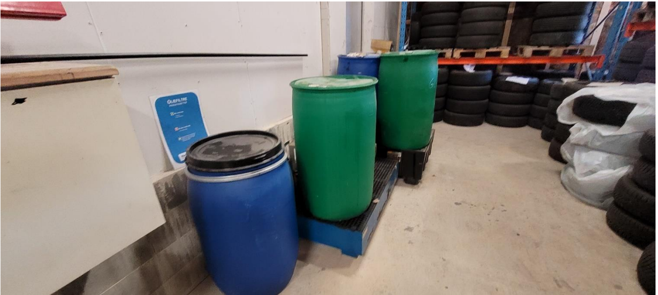
Oplag af spildolie, bremsevæske og oliefiltre.