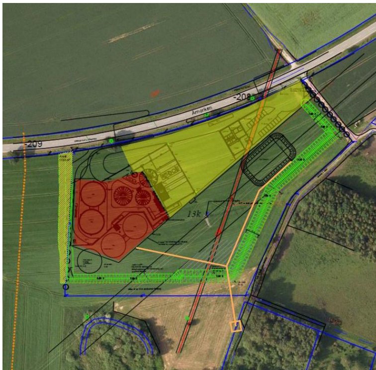
Figur2: Anlægsskitse med visning af udløbsledning og udledningspunkt (orange streg). Skitsen stammer fra den oprindelige ansøgning fra 2015 vedr. regnvandsbassinet og indeholder derfor ikke de nye afstrømningsoplande på Solrød Bioenergi.