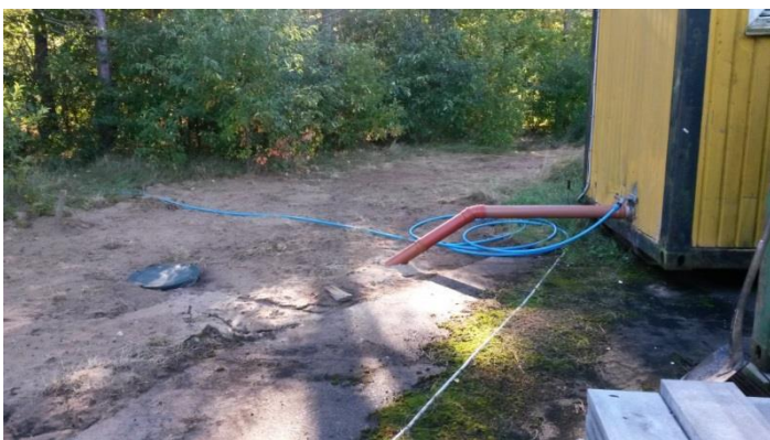
Billede 1 Nedgravet samletank.

Der er også opsat en toilet/omklædningsvogn, hvortil der er nedgravet en septiktank, se billede 1. Tanken tømmes i henhold til kommunal tømningssordning.