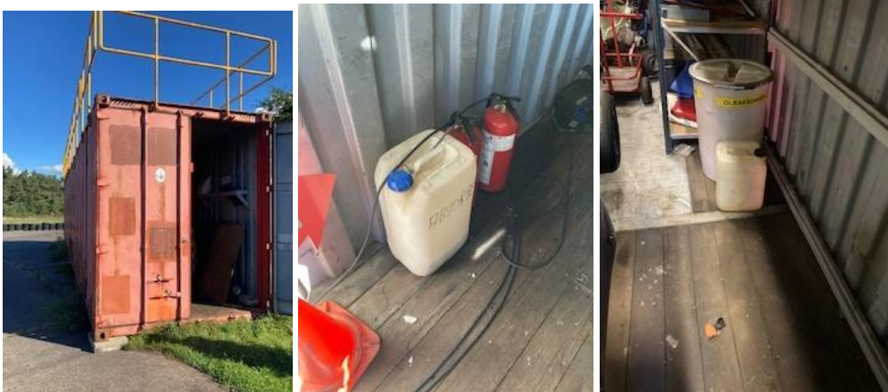
Billede 3 Container hvor olieabsorberende materiale opbevares.

Diverse enkelte mindre dunke med olier, benzin er placeret i containerne, men ikke på spildbakker. Se billede 4.