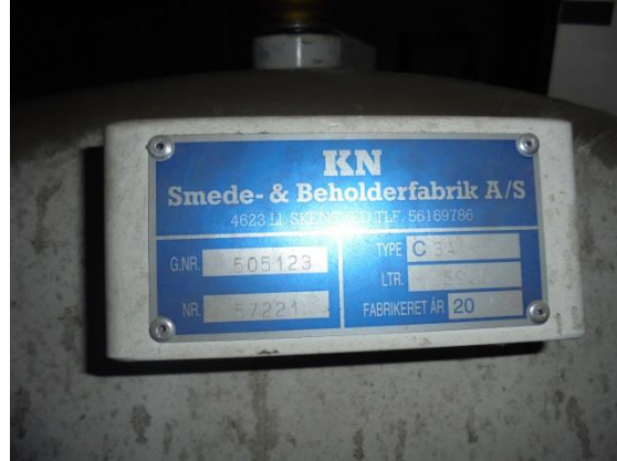
Fabrikeret år: 2013, LTR. 5.900