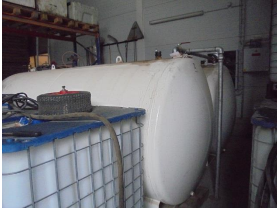
To ens dieseltanke

Der findes to ens dieselolietanke i maskinhallen. De er begge forsynet med mærkeplade. I henhold til BBR findes der ingen olietanke på matriklen. Det indskræpes, at tankene bliver anmeldt til Lolland Kommune.