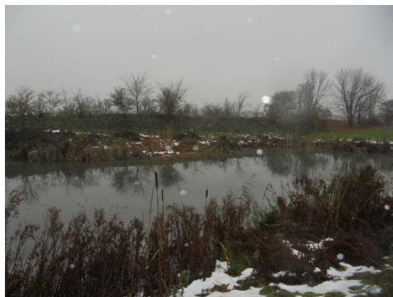
Regnvandsbassin, udløb anes yderst til højre

Der sker ingen vask af kartofler på virksomheden. Der er ingen vand i forbindelse med sortering og pakning af kartoflerne, og der er ingen afløb fra lagerhaller eller produktionshal.