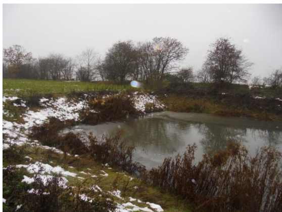
Regnvandsbassin, indløb midt i billedet

Virksomheden har en udledningstilladelse til udledning af regnvand fra virksomheden. Der er den forbindelse etableret et regnvandsbassin ca. 180 m nord for bygningerne. Regnvandsbassinet blev besigtiget under tilsynet. Der føres jævnligt tilsyn med regnvandsbassinets tilstand. Det har endnu ikke været nødvendigt med oprensning af bassinet.