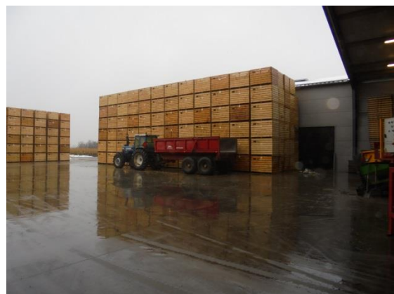
Særlige trækasser, til lagring af kartoflerne inden sortering