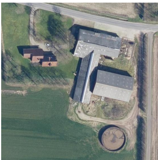
Figur 1. Gyllebeholder på Hellevej 37, hvor der ønskes teltoverdækning.

Varde Kommune har ingen bemærkninger til, at der på ejendommen Hellevej 37, 6818 Årre etableres teltoverdækning på gyllebeholder, der er vist på figur 1.