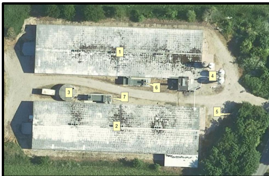
Figur 1. Oversigt over bygninger på Ådumvej 1.

Figur 1 viser en oversigt over anlægget på Ådumvej 1.