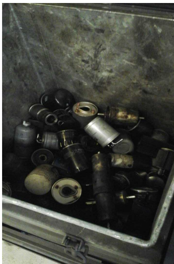
Sortering af farligt affald i forskellige fraktioner