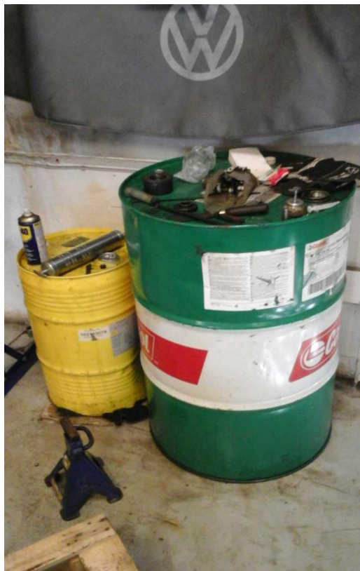
Olie i tønde