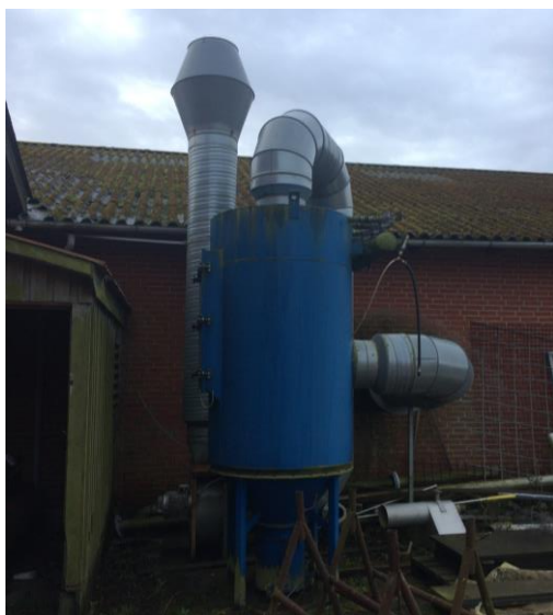
Billede 1. Udsug ved byg. 5

Bekendtgørelsen indeholder krav om afkasthøjder fra udsugningsanlæggene. Den påkrævede afkasthøjde afhænger af antal svejsesteder koblet til anlægget. FK Smedie har oplyst i anmeldelsen at der er 6 svejsesteder på virksomheden. Norddjurs Kommune mangler oplysninge om hvilke svejsesteder der er koblet på hvilke udsugningsanlæg og hvilke svejsemetoder der anvendes for hvert svejsested, samt om der er tale om svejsning i rustfrit stål eller ulegeret stål (eller begge). I bedes føre dette ind på oversigten over jeres udsugningsanlæg og returnere den snarest muligt og senest 15. juni 2018.