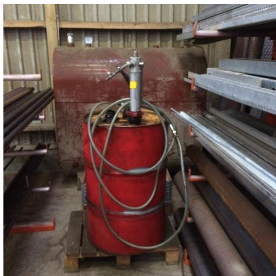
Billede 4. Olietank byg. 7