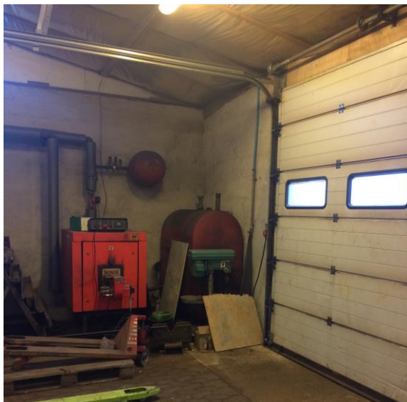
Billede 3. Olietank, Byg. 5

Anmeldelsen skal indeholde en skitse over anlæggets placering på ejendommen, det indtegnes i systemets digitale kort. Til anmeldelsen skal der desuden vedhæftes en tankattest.