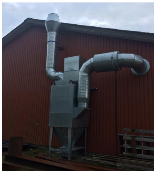
Billede 2. Udsug ved byg. 7