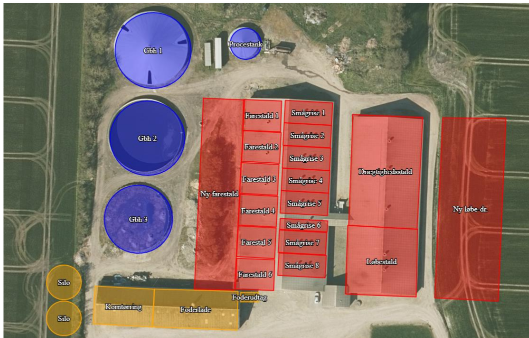
Oversigt over bygninger fra godkendelsen januar 2020