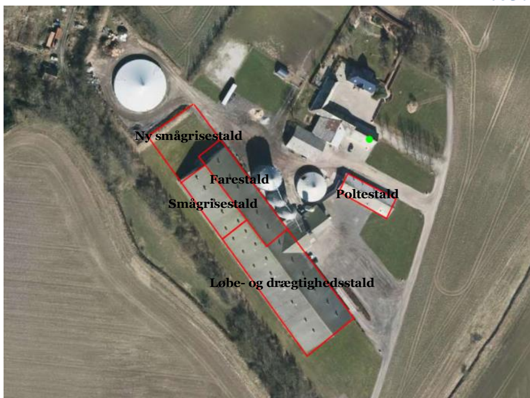
Figur 1: Anlægsoversigt

I nudrift er der 660 stipladser med delvis spaltegulv hvor der produceres 660 års-søer, 3370 stipladser med delvis spaltegulv hvor der produceres 19.800 smågrise (7,2-30kg) og 25 stipladser med drænet gulv+ spalter (33/67) hvor der produceres 100 polte (32-110 kg).