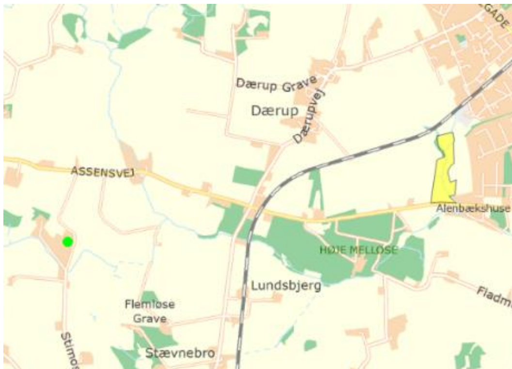
Figur 4: Stokkevadgårds staldanlægs placering i forhold til nærmeste kategori 2-naturområde (markeret med gul farve).

Ifølge Danmarks Miljøportal (arealinfo, oktober 2017) kortværk over registrerede naturarealer ligger nærmeste kategori 2-naturområde ca. 2,5 km øst for staldanlægget og er et overdrev – se figur 4. Påvirkningen fra staldanlægget forventes derfor at være minimal.