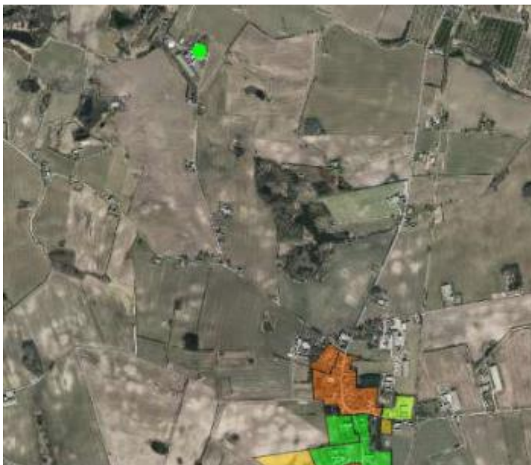
Figur 2: Nærmeste fremtidige byzones beliggenhed i forhold til Stokkevadgård.

Afstandskravet på 50 meter ifølge § 6, stk. 3 til byzone, sommerhusområder og lokalplaner er dermed overholdt.