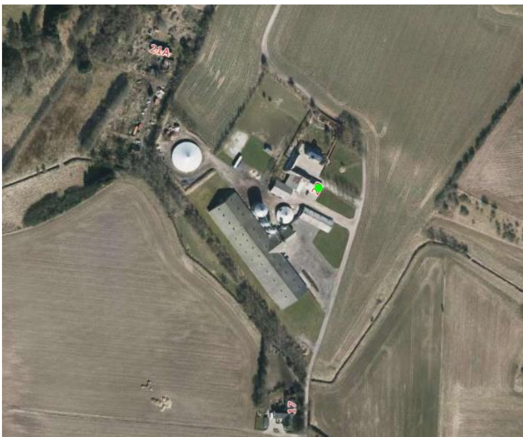
Figur 3: Nærmeste naboer til Stokkevadgård.

Ejendommen på adressen Stimosen 21 ligger kun ca. 76 meter fra stald- og gødningsanlæg på Stokkevadgård, men ifølge Kort- og Matrikelstyrelsen så er ejendommen registreret med landbrugspligt. Den medtages derfor ikke, når der skal foretages lugtvurdering jf. reglerne om det generelle beskyttelsesniveau.