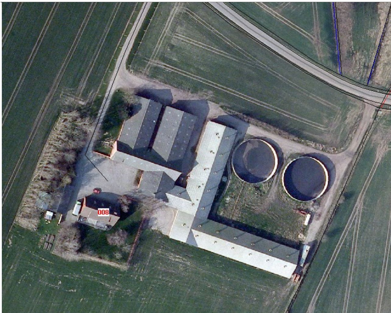
Luffoto af ejendommen Bjerregaard, Staghøjmøllevej 8, 7990 Ø. Assels.