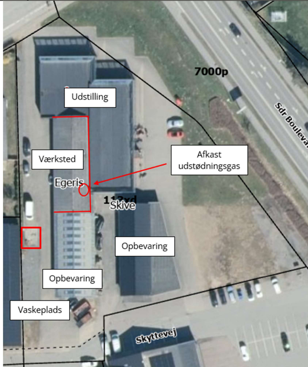
Oversigtsfoto af virksomheden