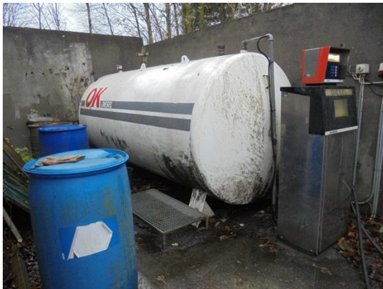
Dieselloletank med stander

Der findes desuden en dieselloletank på 5.900 liter. Tanken benyttes til tankning af virksomhedens køretøjer. Tanken er placeret på terræn ved vaskepladsen. Tanken er forsynet med mærkeplade og er fra 2004.