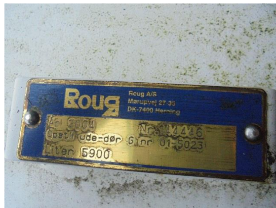
År: 2004, Størrelse: 5.900 liter